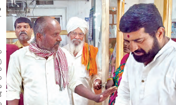
చౌటూరులో తెలంగాణ గ్రామీణ బ్యాంకులో మేనేజర్ తో వాగ్వివాదం దృశ్యం