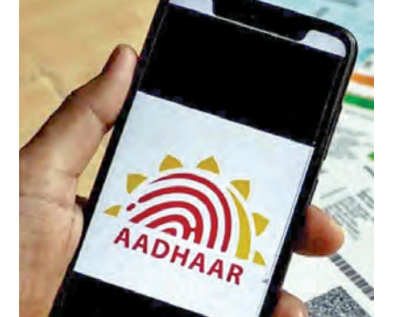
రంగా నిర్ణయం అటోమేటిక్ గా ఏ ఏ ఏ ఏ జనవరి 1వ తేదీని పుట్టిన తేదీగా తీసుకుంటుంది. అందుకే ఇది అన్ని వేళలా కచ్చితమైనది కాదని స్పష్టం చేసింది. ఆధార్ కార్డు సమర్పించిన వ్యక్తి, అయితే మొదటికి డేటా ప్రకారం అతను అనలైన్ వ్యక్తి అవుతాడు కాదా అనే విషయాన్ని

న్యూఢిల్లీ, ఏప్రిల్ 28: ఆధార్ ను కేవలం గుర్తింపు పత్రంగానే పరిగణించాలని, పుట్టిన తేదీ దృవీకరణ పత్రంగా కానీ పేర్కొంటూ ఉత్తర్వులు జారీ చేసింది. ఆధార్ కార్డులో పుట్టిన తేదీ (డీవీటి) ముద్రించి ఉన్నట్లు టీకా, దానిని అధికారిక పుట్టిన తేదీ దృవీకరణ పత్రంగా పరిగణించకూడదని స్పష్టం చేస్తూ ఆధార్ యూజర్స్ ఏజెన్సీలు, ఈ కేసుని యూజర్స్ ఏజెన్సీలకు యువజనం తేజ రానీని. ఆధార్ అనేది ఒక వ్యక్తి యొక్క గుర్తింపును దృవీకరించడానికి ఉద్దేశించినది మాత్రమేనని యువజనం వివరించింది. ఆధార్ నమోదు సమయంలో వినియోగదారులు ఇచ్చే సమాచారం లేదా సూర్య సర్టిఫికేట్లు, పాస్ పోర్ట్ వంటి పత్రాల మేరకు పుట్టిన తేదీని నమోదు చేస్తారు. ఒకవేళ వినియోగదారుడి వద్ద ఎలాంటి అధికారిక పత్రాలు లేకపోతే, వారి వయసు అంచనా ఆధారంగా నిర్ణయం అటోమేటిక్ గా ఏ ఏ ఏ ఏ జనవరి 1వ తేదీని పుట్టిన తేదీగా తీసుకుంటుంది. అందుకే ఇది అన్ని వేళలా కచ్చితమైనది కాదని స్పష్టం చేసింది. ఆధార్ కార్డు సమర్పించిన వ్యక్తి, అయితే మొదటికి డేటా ప్రకారం అతను అనలైన్ వ్యక్తి అవుతాడు కాదా అనే విషయాన్ని