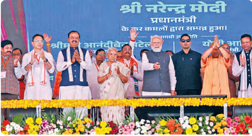
బుధవారం హార్దోయ్ బహిరంగసభలో అధివాదం చేస్తున్న ప్రధాని నరేంద్రమోడీ, మంత్రులు

అని అన్నారు. “మా గంగానది యుపికి, ఈ దేశానికి ఎలా జీవనాధారంగా ఉందో, అదే విధంగా ఈ ఆధునిక ప్రగతి యుగంలో, మా గంగానది సమీపంలోనే ఉన్న ఈ ఎక్స్ ప్రెస్ వే యుపి అభివృద్ధికి ఒక కొత్త జీవనాధారంగా మారుతుంది,” అని ఆయన అన్నారు. లోక్ సభలో మహిళా రిజర్వేషన్ (సవరణ) బిల్లు ఓటమిని “వేడుకగా జరుపుకోవడం” పై సమాజీవాది పార్టీ, కాంగ్రెస్ తో సహా ఇతర ప్రతిపక్ష పార్టీలపై ప్రధానమంత్రి నరేంద్ర మోడీ తీవ్ర స్థాయిలో మండిపడ్డారు. ఈ ఘటన ప్రతి పక్షాల “నిజస్వరూపాన్ని, విస్తృత ముఖాన్ని” బట్టి బయట చేసిందని ఆయన వ్యాఖ్యానించారు. “సమాజీవాది పార్టీ కేవలం అభివృద్ధి వ్యతిరేకి మాత్రమే కాదు, మహిళా వ్యతిరేకి కూడా” అని ఆయన అన్నారు. ఇటీవలి రాజకీయ పరిణామాలు