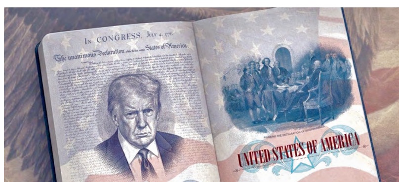
ట్రంప్ పాస్ పోర్టు

వాషింగ్టన్, ఏప్రిల్ 29: అమెరికా అధ్యక్షుడిగా డొనాల్డ్ ట్రంప్ మరో అసాధారణ నిర్ణయంతో వార్డుల్లో నిలిచారు. ప్రభుత్వం సస్పెన్షన్ తనదేనని ముద్ర వేస్తున్న ఆయన, ఇప్పుడు అమెరికన్ పాస్ పోర్టులపై తన ఫోటో, సంతకాన్ని ముద్రించనున్నారు. ఈ చర్యతో దశాబ్దాలుగా పోస్టర్లు ఓ సంప్రదాయానికి తెరదించినట్లుంది. అమెరికా స్వాతంత్ర్య ప్రకటనకు 250 ఏళ్లు పూర్తవుతున్న సందర్భంగా ఈ ప్రత్యేక పాస్ పోర్టులను విడుదల చేయనున్నట్లు యూఎస్ స్టేట్ డిపార్ట్ మెంట్ వెల్లడించింది. ఈ కొత్త పాస్ పోర్టు లో పలికే లో రెండు చిత్రాలు ఉంటాయి. ఒక చిత్రంలో అమెరికా స్వాతంత్ర్య ప్రకటన బలతంపై ట్రంప్ అధికారిక ఫోటో, దాని కింద వందల రంగులో ఆయన సంతకం ఉంటాయి. రెండో చిత్రంలో అమెరికా జాతిపితల చారిత్రక ఫోటోలు ఉంటాయి. జులైలో అమెరికా 250వ వార్షికోత్సవాన్ని జరుపుకుంటున్న వేళ, ఈ చారిత్రక సందర్భాన్ని పురస్కరించుకుని పరిమిత సంఖ్యలో ఈ ప్రత్యేక పాస్ పోర్టులను విడుదల చేస్తున్నట్లు స్టేట్ డిపార్ట్ మెంట్ వెల్లడించింది. ట్రంప్ పింగ్ లో తెలిపారు. ఈ లిమిటెడ్ ఎడిషన్ పాస్ పోర్టులను