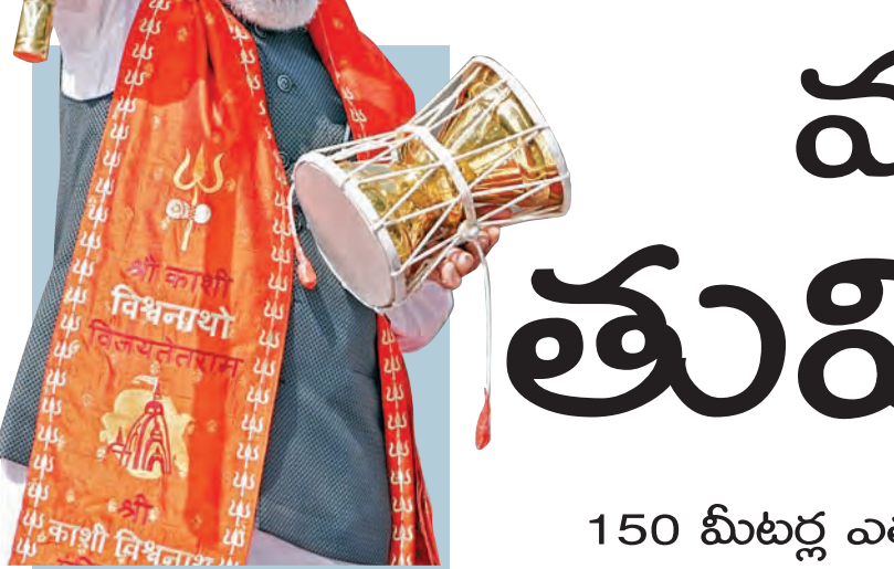
బుధవారం కాశీలో ప్రధాని మోడీ

బెంగాల్ లో ఎన్డీయే! డి. డి. లా పడిన చిద్రే! >>2