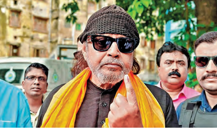
బుధవారం కోల్ కతలో ఓటు వేసిన ఆనంతరం సీరా గుర్తును చూపిస్తున్న బిజెపి నాయకుడు, నటుడు మిథున్ చక్రవర్తి