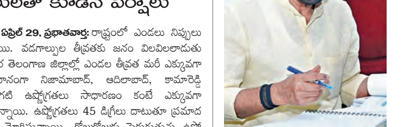
హైదరాబాద్, ఏప్రిల్ 29 ప్రభాతవార్త: హైదరాబాద్ లో పెట్రోలు కొరత లేదని కేంద్ర మంత్రి కిషన్ రెడ్డి పేర్కొన్నారు.

బుధవారం పెట్రోల్, డీజిల్, గ్యాస్ సరఫరా లభ్యత పై కేంద్ర మంత్రి జి. కిషన్ రెడ్డి ఆయిల్ మార్కెటింగ్ కంపెనీల ప్రతినిధులతో దిల్ కుషా గెస్ట్ హౌస్ లో సమీక్ష సమావేశం నిర్వహిస్తున్నారు. అనంతరం మీడియాతో మాట్లాడుతూ తెలంగాణలో సాధారణంగా రోజుకు సుమారు 6400 కిలోలీటర్ల పెట్రోల్ సరఫరా జరుగుతుందని, కానీ ప్రస్తుతం అది 10,300 కిలోలీటర్లకు >>2