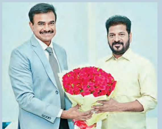
బుధవారం హైదరాబాద్‌లో సీఎం రేవంత్‌ను మర్యాదపూర్వకంగా కలిసి వుప్పుగుచ్చుం అందజేస్తున్న నూతన డిజిపి ఆనంద్