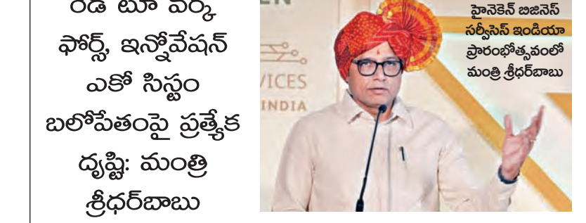
హైదరాబాద్ బిజినెస్ సర్వీసెస్ మాబ్ గా తీర్చిదిద్దేందుకు ప్రణాళికాబద్ధంగా కృషి చేస్తున్నామని రాష్ట్ర ఐటీ, పరిశ్రమలశాఖ మంత్రి దుద్దిళ్ల శ్రీధర్ బాబు అన్నారు.

గ్లోబల్ కేవలం టీ సెంటర్ (జిసీసీ)ను కేవలం బ్యారేజీ ఆఫీస్ ఆవరేషన్ వరకే పరిమితం చేయకుండా... స్ట్రాటజీక్ ఇన్ఫ్రాస్ట్రక్చర్, హై వాల్యూ ప్రొడక్టివిటీ కేంద్రాలైన గ్లోబల్ వాల్యూ సెంటర్ (జిసీసీ)గా మార్చేలా సమగ్ర రోడ్డు మ్యాప్ ను సిద్ధం చేస్తున్నామన్నారు. ప్రపంచంలోని రెండో అతిపెద్ద బ్రూయింగ్ కంపెనీ హైనెస్ నాస్ రాంగూడ పై నాస్ యల్ డిస్ట్రిబ్యూట్ హైనెస్ బిజినెస్ సర్వీసెస్ ఇండియా పేరిట 76వేల చదరపు అడుగుల విస్తీర్ణంలో ఏర్పాటు చేసిన జిసీసీని బుధవారం ఆయన లాంఛనంగా ప్రారంభించారు. ఈ సందర్భంగా మాట్లాడుతూ... హైనెస్ లాంటి దిగ్గజ సంస్థలు హైదరాబాద్ ను ఎంచుకోవడం ఇక్కడ ప్రపంచ స్థాయి మోజుక సదుపాయాలు, రెడీ టూ కొలాబోరేట్, రాష్ట్ర ప్రభుత్వ ప్రగతిశీల విధానాలు, పారిశ్రామిక ప్రగతికి నిదర్శనమన్నారు. హైదరాబాద్ కేవలం ఐటీ డెస్టినిటీగా కాకుండా ప్రపంచ శ్రేణి వ్యాపార పరిష్కారాలకు చిరునామాగా మారతోందన్నారు. అంతర్జాతీయ ఐటీ దిగ్గజాల మొదలు మ్యాను ఫ్యాక్చరింగ్, కన్స్యూమర్ గూడ్స్ కంపెనీల వరకు తమ వ్యూహాత్మక కేంద్రాల ఏర్పాటు కోసం హైదరాబాద్ ను మొదటి ప్రాధాన్యతగా ఎంచుకుంటున్నామన్నారు. ఆ జాబితాలో 150 ఏళ్ల పునః ప్రతికే కలిగిన హైనెస్ కూడా చేరడం వల్ల ప్రపంచ పటంలో తెలంగాణ ట్రాండ్ మరెంత విశ్వవ్యాప్తమవుతుందన్నారు. మరిన్ని అంతర్జాతీయ సంస్థలను ఆకర్షించేలా >>2