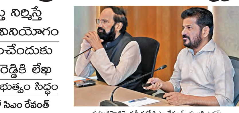
తుమ్మిడిహెట్టిపై సమీక్షలో సిఎం రేవంత్, మంత్రి ఉత్తమ్

వడివడిగా తుమ్మిడిహెట్టి 150 మీటర్ల ఎత్తు నిర్మిస్తే 10 టిఎంసీల నీరు వినియోగం మహారాష్ట్రను ఒప్పించేందుకు కేంద్ర మంత్రి కిషన్ రెడ్డికి లేఖ ముంపు పరిహారానికి ప్రభుత్వం సిద్ధం బ్యారేజీ నిర్మాణంపై సమీక్షలో సిఎం రేవంత్ >>2