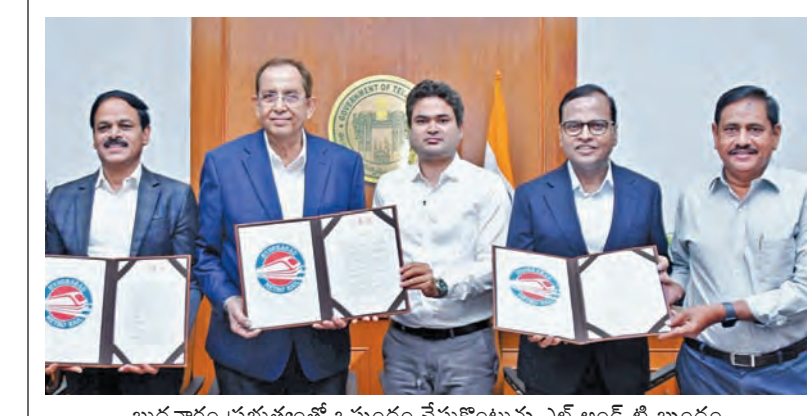
బుధవారం ప్రభుత్వంలో ఒప్పందం చేసుకొంటున్న ఎల్ అండ్ టీ బృందం