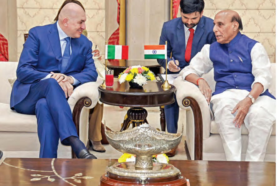
న్యూఢిల్లీలో గురువారం రక్షణ మంత్రి రాజ్ నాథ్ తో భేది అయిన ఇటలీ రక్షణ మంత్రి గ్రెడో క్రోస్టో