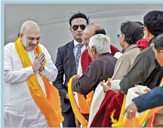
లేహోలోని విమానాశ్రయంలో గురువారం కేంద్ర హోం మంత్రి అమిత్ షాకు సాగ్గతం పలుకుతున్న లడభే తెట్టెనెట్ గవర్నర్ వినయ్ కుమార్ సచ్చేనా తదితరులు