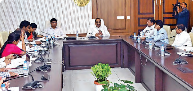
సమావేశంలో మాట్లాడుతున్న మంత్రి తుమ్మల నాగేశ్వరరావు

హైదరాబాద్, ఏప్రిల్ 30, ప్రభాతవార్త: తెలంగాణలో నకిలీ విత్తనాలపై జీరో టాలరెన్స్ విధానం అమలు చేయాలని అధికారులకు రాష్ట్ర వ్యవసాయ శాఖ మంత్రి తుమ్మల నాగేశ్వరరావు స్పష్టం చేశారు. ఈ మేరకు గురువారం సచివాలయంలో వ్యవసాయశాఖ అధికారులు, విత్తన కంపెనీ ప్రతినిధులతో ఆయన సమీక్ష నిర్వహించారు. రైతులకు అవగాహన కార్యక్రమాల నిర్వహిస్తూ విత్తన కంపెనీలతో సమన్వయం కొనసాగించాలని సూచించారు. నకిలీ విత్తనాలను అరికట్టేందుకు పోలీసుశాఖతో సమన్వయం చేసుకుని కట్టుదిట్టమైన చర్యలు తీసుకోవాలని వ్యవసాయ శాఖ అధికారులను ఆదేశించారు. గతంలో బాణ్యత తక్కువగా ఉన్న విత్తనాలపై కేసులు నమోదు చేసి లైసెన్సులు రద్దుచేసిన విషయాన్ని గుర్తు చేశారు. ప్రతి నెలగా రూరల్ కంపెనీల విత్తన నిల్వ వివరాలను ప్రభుత్వానికి అందజేయాలని, గతంలో నల్లపల్లె విత్తనాలపై నష్టం కలిగితే కంపెనీలో భరించాలని తేల్చి చెప్పారు. ఖరీదైన సాగు ప్రాంతం కానున్న నేపథ్యంలో నకిలీ విత్తనాలపై ఎప్పుడోకప్పుడు నిషేధాన్ని మంత్రి సూచించారు. జిల్లా సంబంధ మండల స్థాయివరకు ప్రత్యేక టాస్కఫోర్స్ బృందాలు ఏర్పాటు చేయాలన్నారు. అక్రమ నిల్వలు, రవాణా, విక్రయాలపై కఠిన చర్యలు తీసుకోవాలని ఆదేశించారు. ముఖ్యంగా విడి పత్తి విత్తనాల అక్రమ రవాణాను అరికట్టేందుకు రాష్ట్ర సరిహద్దుల్లో కట్టుదిట్టమైన తనిఖీలు నిర్వహించాలని సూచించారు. విత్తనాల సరఫరా వ్యవస్థలో పాత దర్యుత పెంపొందించు లైసెన్సింగ్ వ్యవస్థను బలోపేతం చేయాలని నిర్దేశించారు. జి.బి. ఘోషల్