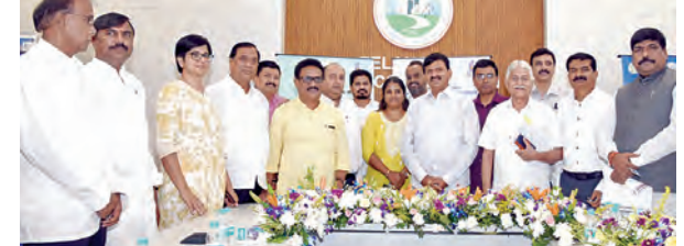
పాత్రికేయ సంఘాల నేతలతో మంత్రి పొంగులేటి శ్రీనివాసరెడ్డి

హైదరాబాద్, ఏప్రిల్ 30, ప్రభాతవార్త ప్రధాన ప్రతినిధి: రాష్ట్రంలో అర్హతైన ప్రతి జర్నలిస్టుకు అక్రిడిటేషన్ మంజూరు చేసేందుకు ప్రభుత్వం కృతనిశ్చయంతో ఉందని రాష్ట్ర సమాచార, రెవెన్యూ, హోసింగ్ శాఖ మంత్రి పొంగులేటి శ్రీనివాసరెడ్డి స్పష్టం చేశారు. పాత్రికేయులకు ఆరోగ్యతోపాటు మరిన్ని సౌకర్యాలు కల్పించేందుకు ప్రభుత్వం సిద్ధంగా ఉందని అన్నారు. గురువారం నాడు సమాచార శాఖ అధ్యక్షులు జర్నలిస్టులకు కొత్త అక్రిడిటేషన్ కార్డులను మంత్రి అందజేశారు. ఈ సందర్భంగా మంత్రి ముఖ్యమంత్రి గత ప్రభుత్వం ఇచ్చిన అక్రిడిటేషన్ కార్డులను ఇంతవరకు పొడిగించామని, దేశంలో, ఇతర రాష్ట్రాల్లో అమలు చేస్తున్న ఉత్తమ విధానాలను ఇక్కడ అనుసరించాలని అందజేశారు. మంజూరులో వెనకదగు ప్రస్తోతే లేదని అన్నారు. మే 1వ తేదీన అన్ని జిల్లాల్లో అక్రిడిటేషన్ కార్డుల పంపిణీ చేయాలంటూ కలెక్టర్లకు ఆదేశాలు జారీ చేస్తామని మంత్రి పొంగులేటి ప్రకటించారు. ఈ ప్రక్రియలో మే 10 వతేదీన ఒక కలాఫ్ డేట్ గా పెట్టుకోవాలని చెప్పినట్లుగా, ఆ తేదీలోగా వచ్చే దరఖాస్తులను ఏమాదింపడం జరుగుతుందని మంత్రి తెలిపారు. రాష్ట్రంలో అక్రిడిటేషన్