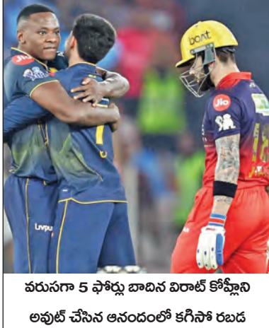
వరుసగా 5 ఫోర్లు బాదిన మిరాట్ కోస్టియూక్ అవుట్ చేసిన అనందంలో కిగిరీ రబబ

మహిళల సింగిల్స్లో మార్కా కోస్టియూక్ జైత్రయాత్ర కొనసాగిస్తూ సెమీఫైనల్ చేరింది. క్వార్టర్ ఫైనల్లో ఆమె 7-6, 6-0తో 13వ సీడ్ లిందా నోస్కోవ్కా గెలిచి వరుసగా 10వ విజయాన్ని నమోదు చేసింది. ఈ విజయంతో ఆమె లక్సీ లూజెర్ అనస్టాసియా పాటాచోవాతో సెమీఫైనల్ పోరుకు అర్హత సాధించింది. 26వ సీడ్ అయిన ఈ ఉక్రెనియన్ క్రీడాకారిణి 23 ట్రైక్ పాయింట్లను సృష్టించింది.