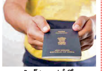
హెచ్ 1 బి లాటరీలో

ఢిల్లీ, ఏప్రిల్ 30: మధ్యప్రదేశ్ లోని ధారణిల్లాలో గత రాత్రి కూలీలతో వెళ్తున్న బస్సులో 15 మంది దుర్మరణం చెందారు. వీరిలో మహిళలు, చిన్నారులు ఉన్నారు. మరో 30 మందికి తీవ్రంగా గాయం పడ్డారు. ఇండోర్ అమ్మావారి జాతీయ రహదారి వద్ద ఈ విషాద ఘటన జరిగింది. పోలీసుల విచారణ ప్రకారం, పనులు ముగించుకుని సుమారు 40 మందికి పైగా కూలీలు ఒక బస్సులో తమ గ్రామాలకు తిరుగు ప్రయాణమయ్యారు. సామర్థ్యానికి మించి ప్రయాణితులతో, అతివేగంతో వెళ్తున్న వాహనం చిక్కియా పాటా సమీపంలో నియంత్రణ కోల్పోయింది. దీంతో వాహనం పలు మార్లు పట్టి కొట్టి, డివైడర్ దాటి ఎదురుగా వస్తున్న ఎన్ యూపీని ఢీకొట్టింది. ప్రమాద తీవ్రతకు వ్యానోల్ ఉన్నవారు దాని కింద నలిగి