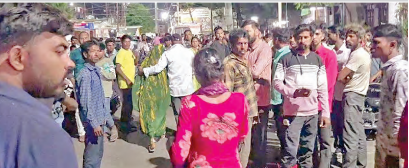
సంఘటనా స్థలంలో రోడ్డున వ్యాధిగ్రస్తుల కుటుంబసభ్యులు.

15 మంది దుర్మరణం... 30 మందికి తీవ్ర గాయాలు