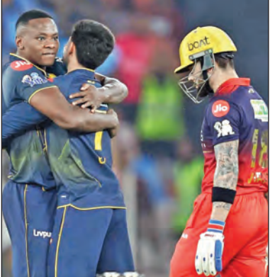
వరుసగా 5 ఫోర్లు బాదిన మిరాట్ కోస్టియూక్ అవుట్ చేసి ఆనందంలో కలిగి రబబ

మహిళల సింగిల్స్లో మార్కా కోస్టియూక్ జైత్రయాత్ర కోనసాగిస్తూ సెమీఫైనల్ చేరింది. క్వార్టర్ ఫైనల్లో ఆమె 7-6, 6-0తో 13వ సీడ్ లిందా నోస్కోవ్కా గెలిచి వరుసగా 10వ విజయాన్ని నమోదు చేసింది. ఈ విజయంతో ఆమె లక్సీ లూజర్ అనస్సానియా పొటావోవాతో సెమీ ఫైనల్ పోరుకు అర్హత సాధించింది. 26వ సీడ్ అయిన ఈ ఉక్రెనియన్ క్రీడాకారిణి 23 ట్రైక్ పాయింట్లను సృష్టించింది.