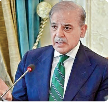
పాక్ ప్రధాని షేహబాజ్ షరీఫ్

సాగుతోందని వివరించారు. ఇరాన్ విదేశాంగ మంత్రి అజ్హార్ అరఫ్ఘీ తన బృందంతో పాకిస్తాన్లో పర్యటించి, పలు దశాబ్దాల చర్చలు జరిపారని ప్రధాని వెల్లడించారు. తనతో రెండు గంటల పాటు సమావేశమయ్యారని, తమ నాయకత్వంతో సంబంధించిన తర్వాత సానుకూల నిర్ణయం తీసుకుంటామని అరఫ్ఘీ హామీ ఇచ్చారని చెప్పారు. అరఫ్ఘీ రష్యా చర్చలకు ముందు ఘోస్లో మాట్లాడారని, ఒమన్లో జరిగిన సమావేశాలు సానుకూల దృక్పథంతో జరిగాయని ఆయన చెప్పినట్లు షేహబాజ్ తెలిపారు. త్వరలోనే ఈ విషయం ముగిస్తుందని ఆశాభావం వ్యక్తం చేశారు. త్వరలో రెండో విడత చర్చలకు సిద్ధంగా ఉన్నామని అమెరికా అధ్యక్షుడు బ్రంక్ ఇటీవల పునరుద్ఘాటించారు. ఫిబ్రవరి 28న అమెరికా, ఇజ్రాయేల్ సంయుక్తంగా జరిపిన డాక్టో ఇరాన్ సుప్రీం లీడర్ ఆయతుల్లా అలీ ఖమేనే, పలువురు ఉన్నత కమాండర్లు మరణించడంతో ఈ యుద్ధం ప్రారంభమైంది. ఇరాన్ ప్రతీకార చర్యలతో ఈ ఘర్షణ గల్ఫ్ ప్రాంతమంతటా విస్తరించిన విషయం తెలిసింది.