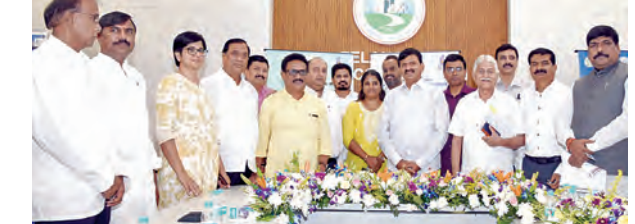
పాత్రికేయ సంఘాల నేతలతో మంత్రి పొంగలేటి శ్రీనివాసరెడ్డి

హైదరాబాద్, ఏప్రిల్ 30, ప్రభాతవార్త ప్రధాన ప్రతినిధి: రాష్ట్రంలో అర్హతైన ప్రతి జర్నలిస్టుకు అక్రిడిటేషన్ మంజూరు చేసేందుకు ప్రభుత్వం కృతనిశ్చయంతో ఉందని రాష్ట్ర సమాచార, రెవెన్యూ, హౌసింగ్ శాఖ మంత్రి పొంగలేటి శ్రీనివాసరెడ్డి స్పష్టం చేశారు. పాత్రికేయులకు ఆరోగ్యతోపాటు మరిన్ని సౌకర్యాలు కల్పించేందుకు ప్రభుత్వం సిద్ధంగా ఉందని అన్నారు. గురువారం నాడు సమాచార శాఖ అధ్యక్షులు జర్నలిస్టులకు కొత్త అక్రిడిటేషన్ కార్డులను మంత్రి అందజేశారు. ఈ సందర్భంగా మంత్రి ముఖ్యమంత్రి గత ప్రభుత్వం ఇచ్చిన అక్రిడిటేషన్ కార్డులను ఇంతవరకు పొడిగించామని, దేశంలో, ఇతర రాష్ట్రాలలో అమలు చేస్తున్న ఉత్తమ విధానాలను ఇక్కడ అనుసరించాలని ఆలోచన చేసిన పరిశీలన సాగిందని అందువల్లే ఈ కార్డుల జారీలో అలస్యం చోటుచేసుకుందన్నారు. గత ప్రభుత్వం 32,500 మందికి అక్రిడిటేషన్ ఇచ్చి అవకాశం ఉన్నా 23,352 కే పరిమితం చేసిందన్నారు. తమ ప్రభుత్వం ఇప్పుడు సుమారు 46 వేల మందికి పైగా అక్రిడిటేషన్ ఇచ్చేలా ఇప్పుడు ముందుకు వెళ్తున్నట్లు తెలిపారు. ఇప్పటికే సుమారు 2,800 వరకు కార్డులను ఆమోదించడం జరిగిందని వివరించారు. జర్నలిస్టుల సూచనల మేరకు జీవోలలో మార్పులు చేర్పులు చేశామని, అర్హతైన జర్నలిస్టులకు కార్డుల మంజూరులో వెనకడుగు ప్రసక్తి లేదని అన్నారు. మే 1వ తేదీన అన్ని జిల్లాల్లో అక్రిడిటేషన్ కార్డుల పంపిణీ చేయాలంటూ కలెక్టర్లకు ఆదేశాలు జారీ చేస్తామని మంత్రి పొంగలేటి ప్రకటించారు. ఈ ప్రక్రియలో మే 10 వతేదీన ఒక కలాఫ్ డేట్ గా పెట్టుకోని దరఖాస్తులు చేసుకోవాలని, ఆ తేదీలోగా ఒకటి దరఖాస్తులు ఆమోదించడం జరుగుతుందని మంత్రి తెలిపారు. రాష్ట్రంలో అక్రిడిటేషన్