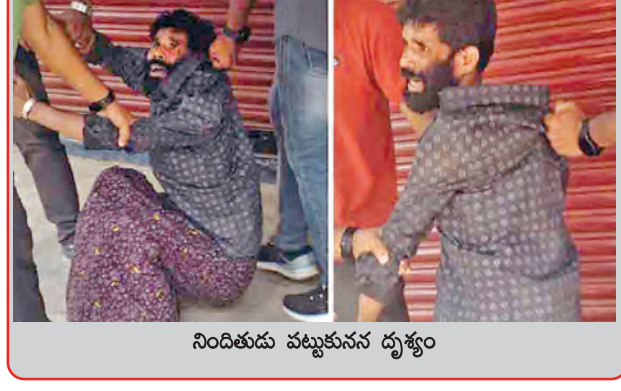
నిందితుడు పట్టుకున్న దృశ్యం