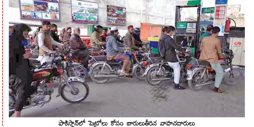
పాకిస్తాన్ లో పెట్రోలు కోసం భారులు తీసిన వాహనాలను

కరాచి, మే 1: తీవ్ర ఇంధన సంక్షోభంతో పాకిస్తాన్ అర్ధవృత్తిలో. సహజ వాయువు (సీఎన్జీ) కొరతతో ఇబ్బందులు పడుతున్న ప్రజలపై ప్రభుత్వం మరో భారం వడింది. తాజాగా పెట్రోల్, హైస్పీడ్ డీజిల్ (హెఎస్ఎం) ధరలను భారీగా పెంచతూ నిర్ణయం తీసుకుంది. ఇరాన్ అమెరికా ఉద్బ్రేతల నేపథ్యంలో హర్షజన్ జల సంధిలో రవాణాకు అటంకాలు ఏర్పడటంతో ఈ పెంపు తప్పలేదని ప్రభుత్వం పేర్కొంది. ఈ కొత్త ధరల వారం రోజుల పాటు అమల్లో ఉంటాయని తెలిపింది. పాకిస్తాన్ పెట్రోలియం డివిజన్ విడుదల చేసిన నోటీఫికేషన్ ప్రకారం హైస్పీడ్ డీజిల్ ధర లీటరుకు 19.39 పాకిస్తాన్ రూపాయలు పెరిగి, 380.19 నుంచి 399.58కి చేరింది. పెట్రోల్ ధర లీటరుకు 6.51 పెరగడంతో, పాత ధర 393.35 నుంచి 399.86కి ఎగతాళింది. పాకిస్తాన్ లో హైస్పీడ్ డీజిల్ ప్రధానంగా ప్రజలకు అత్యంత అవసరం కావడంతో సామాన్య ప్రజలకు అత్యంత భారం చెల్లించు అయింది. ప్రస్తుతం దేశంలో బంబలు సాగు సీజన్ సమయం పూర్తిగా నిలిచిపోయిన రవాణా వాహనాలపై తీవ్ర ప్రభావం చూపే అవకాశం ఉంది. రవాణా