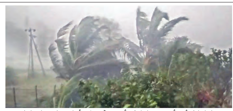
శుక్రవారం ఉత్తరాంధ్రలోని పలు ప్రాంతాల్లో ఈదురు గాలులతో భారీ వర్ష దృశ్యం

శుక్రవారం గుడ్లపల్లెలో ఎల్వీ ప్రసాద్ ఐ కేర్ సెంటర్ను ప్రారంభిస్తున్న సీఎం చంద్రబాబు గ్రామీణులకూ నేత్ర వైద్యం అందుబాటులోకి గుడ్లపల్లెలో ఎల్వీ ప్రసాద్ ఐ కేర్ సెంటర్ను ప్రారంభించిన సీఎం చంద్రబాబు >>2