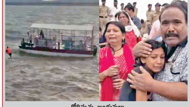
కోల్ కతాలోని బంధువులు

వేరుకున్నారు. ఈవీఎంసీల డ్యూటీలను చేసేందుకు ప్రయత్నిస్తే ప్రాణాలకు తెగింది పోరాడతామని ఆమె స్పష్టం చేశారు. ఈవీఎంసీ భద్రతపై అనుమానాలు వ్యక్తం చేస్తూ ఆమె స్వయంగా కోల్ కతాలోని ఓ స్ట్రాంగ్ రూమ్ వద్ద మూడు గంటలకు పాటు ఉన్నారు. దక్షిణ కోల్ కతాలోని సాజావత్ మెమోరియల్ స్కూల్లో భవానీపూర్ నిమోజన వర్గానికి సంబంధించిన ఈవీఎంసీల భద్రపరిచారు. ఈ స్ట్రాంగ్ రూమ్ లో అవకతవకలు జరుగుతున్నాయని, బ్యారెట్ బ్యాంకులను తెలుస్తున్నారని టీఎంసీ ఆరోపించింది. దీనికి సంబంధించిన వీడియోలు టీఎంసీ చూసిన తర్వాత మమతా బెనర్జీ