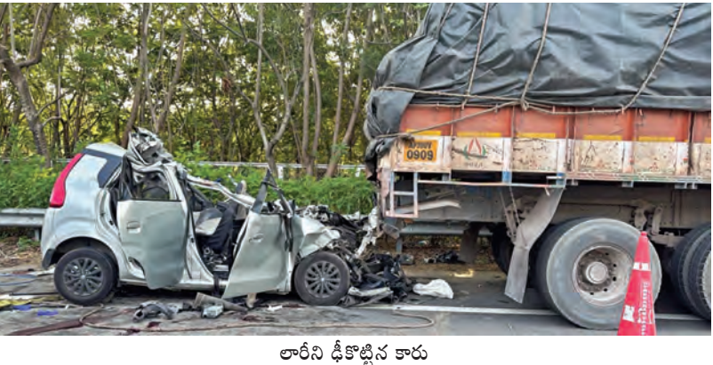
లారీని ఢీకొట్టిన కారు