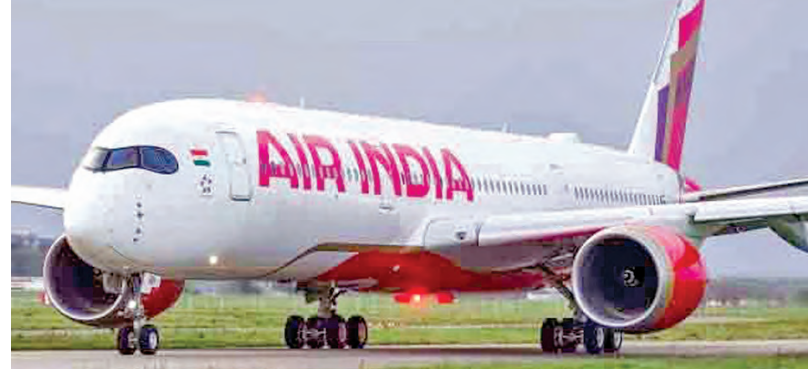
పెట్టుతుంది. అలాగే, ఢిల్లీ, ముంబై నగరాలకు లండన్, ప్యారిస్, న్యూయార్క్, బొంబేలో శాన్ ఫ్రాన్సిస్కో, సిడ్నీ, మెల్బోర్న్ నుంచి

ముంబయి, మే 1: ఏవియేషన్ టర్నెట్ వ్యూయల్ ధరలు భారీ పెరిగిన క్రమంలో ప్రముఖ విమానయాన సంస్థ ఎయిరిండియా ఆర్థిక భారంగా మారిన పలు మార్గాలలో విమాన సర్వీసులను నిలిపివేయాలని నిర్ణయించింది. ఈ క్రమంలో రోజువారీగా 100 సర్వీసులను తగ్గించుకోనుంది. ఏటీఎఫ్ టిఎఫ్ కు ఇంధన ధరలు పెరిగినందున కొన్ని మార్గాలకు విమానాలను నడపడం ఆర్థిక భారంగా ఎయిరిండియా భావిస్తోంది. ఎయిరిండియా రోజువారీ సగటున 1,100 సర్వీసులను నడుపుతోంది. ఇంధన వినియోగం అధికంగా ఉండి, మార్కెట్టు అంతగా లేని యూరప్, ఉత్తర అమెరికా, ఆస్ట్రేలియా, సింగపూర్ వంటి సుదూర అంతర్జాతీయ మార్గాలలోని సర్వీసులకు ప్రధానంగా కోత పెట్టనుంది. అలాగే, ఢిల్లీ, ముంబై నగరాలకు లండన్, ప్యారిస్, న్యూయార్క్, బొంబేలో శాన్ ఫ్రాన్సిస్కో, సిడ్నీ, మెల్బోర్న్ నుంచి