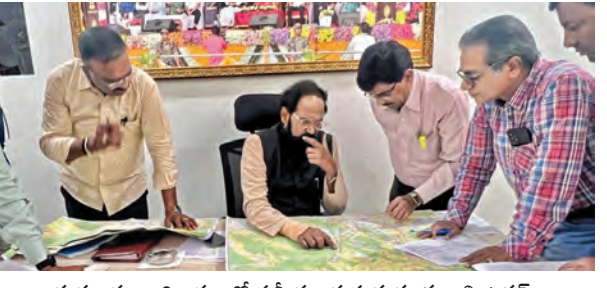
శుక్రవారం అధికారులతో సమీక్ష జరుపుతున్న మంత్రి ఉత్తమ్

హైదరాబాద్, మే 1: ప్రభాతవార్త: ఉమ్మడి ఆంధ్రప్రదేశ్ ముఖ్యమంత్రి దివంగత ముఖ్యమంత్రి డాక్టర్ వైఎస్ రాజశేఖరరెడ్డి ఆధ్వర్యంలో కాంగ్రెస్ ప్రభుత్వం ప్రారంభించిన చేపట్టిన ప్రాజెక్టుల వద్ద బ్యారేజీ నిర్మాణానికి రాష్ట్ర ప్రభుత్వం కట్టుబడి ఉందని రాష్ట్ర నీటిపారుదల, పౌర సరఫరాలశాఖమంత్రి ఉత్తమ్ కుమారరెడ్డి మరోసారి స్పష్టం చేశారు. అందుకాగా తుమ్మిడిహాట్టి వద్ద నిర్మించే తలచేసిన బ్యారేజీ నిర్మాణానికి మహారాష్ట్రలో సంప్రదింపులు జరిపేందుకు మార్చి స్టాంపులో సాంకేతిక ప్రతిపాదనలు సిద్ధం చేయాలని ఆర్డీ అసోసియేట్స్, ఐఐఐఐ హైదరాబాద్ ను ఆదేశించారు. ఈ మేరకు బేగం పేటలోని తన క్యాంపు కార్యాలయంలో శుక్రవారం మంత్రి ఉత్తమ్ ప్రత్యేక సన్మానక సమావేశం నిర్వహించారు. ఈ సందర్భంగా మాట్లాడుతూ మహారాష్ట్రలోని భూభాగంలోపాటు చట్టాల వ్యతిరేకంగా అభయరణ్యంలో ముంపు ప్రభావం తగ్గేలా ప్రణాళికలు రూపొందించాలని సూచించారు. ముంపు ప్రభావిత ప్రాంతాలకు అవసరమైతే సన్న పరివహాన్ని చెల్లించేందుకు తెలంగాణ ప్రభుత్వం సిద్ధంగా ఉందన్నారు. మహారాష్ట్ర ప్రభుత్వం గతంలో 148 మీటర్ల ఎత్తులో బ్యారేజీ నిర్మాణానికి అంగీకరించిన విషయాన్ని ఆయన ప్రస్తావించి తక్కువ వ్యయంతో వరద నీటి ప్రవాహాన్ని వినియోగించేలా నిర్మాణం చేపట్టేలా ప్రతిపాదనలు ఉండాలన్నారు. సాంకేతిక వైపున, ఆర్థిక ప్రయోజనాలతోపాటు సమగ్రంగా అభ్యయనం చేయాలని ఆయన స్పష్టం చేశారు. తుమ్మిడిహాట్టి వద్ద బ్యారేజీ నిర్మాణానికి గాను అంతర్ రాష్ట్ర చర్చలకు ముందే ప్రత్యామ్నాయ మార్గాలు, సాఫ్ట్ వేర్లు, ఖర్చు