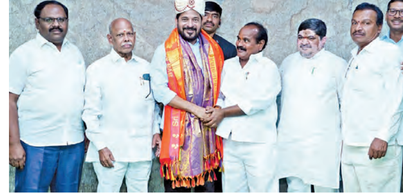
శుక్రవారం హైదరాబాద్ లో ఆర్టీసీ కార్మిక సంఘాల ప్రతినిధులు సీఎం రేవంత్ రెడ్డిని సన్మానించిన దృశ్యం

ప్రభాతవార్త ప్రధాన ప్రతినిధి హైదరాబాద్, మే 1: ఆర్టీసీ మనుగడ, గౌరవాన్ని పెంపొందించి ప్రయాణికులకు మెరుగైన సేవలందించేందుకు సమగ్ర కార్యాచరణతో ముందుకు రావాలని కార్మిక సంఘాల ప్రతినిధులకు ముఖ్యమంత్రి ఎ.రేవంత్ రెడ్డి సూచించారు. గుర్తింపు సంఘం ఎన్నికలు, విలీనంపై అన్ని సంఘాల నాయకులు సమావేశమై సమగ్రకార్యాచరణ రూపొందించాలని సీఎం సూచించారు. పీఆర్డీ అంశాన్ని తాము పరిష్కరిస్తామని సీఎం హామీ ఇచ్చారు. సీఎం ఎ.రేవంత్ రెడ్డి, రవాణా శాఖ మంత్రి పొన్నం ప్రభాకర్, ఇతర ఉన్నతాధికారులతో ఆర్టీసీ కార్మిక సంఘాల ప్రతినిధులు జూబ్లీహిల్స్ లోని సీఎం నివాసంలో శుక్రవారం సాయంత్రం సమావేశమయ్యారు. ఈ సందర్భంగా సీఎం రేవంత్ రెడ్డి మాట్లాడుతూ గుర్తింపు సంఘం ఎన్నికలు, విలీనంపై వివిధంగా ముందుకు పోవాలనే దానిపై సంఘాల నాయకులు సమావేశమై ప్రభుత్వం ఎదుట ఆప్తులు ఉంచాలని సూచించారు. ఒకవేళ యూనియన్ల మధ్య ఏకాభిప్రాయం కుదరకపోతే ఏ యూని యునీ ఆ యూనియన్ తమ ఆప్తుల ఇష్టానుసారంగా ఉన్న వాటికి ఆమోదం తెలిపి, భిన్నా భిన్నాయాలు ఉన్న వాటిపై చర్చిస్తామని సీఎం అన్నారు. ఆసక్తి ఇబ్బందులున్నా ఉద్యోగులు, కార్మికులు సమస్యల పరిష్కారానికి