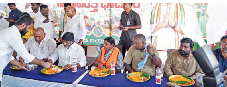
శుక్రవారం మిర్యాలగూడలో మేడీ వేడుకల్లో పాల్గొని పారిశుధ్య కార్యకర్తలతో కలిసి సహపత్రి భోజనం చేసిన డి.సిఎం భట్టి