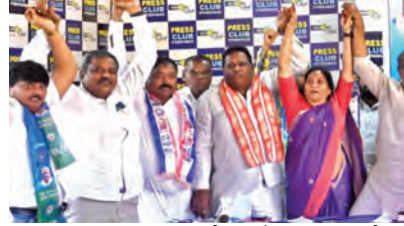
శనివారం జరిగిన సమావేశంలో అఖిలపక్ష పార్టీలు, బిసి సంఘాల నేతలు వెల్లడించారు.