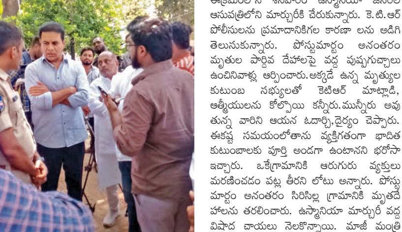
ఘోర రోడ్డు ప్రమాదంలో సిరిసిల్లకు చెందిన ఆరుగురు మృతుల మృతి చెందిన చెండడం వల్ల ఆయన తీవ్రదాగ్నియైన వ్యక్తం చేశారు.