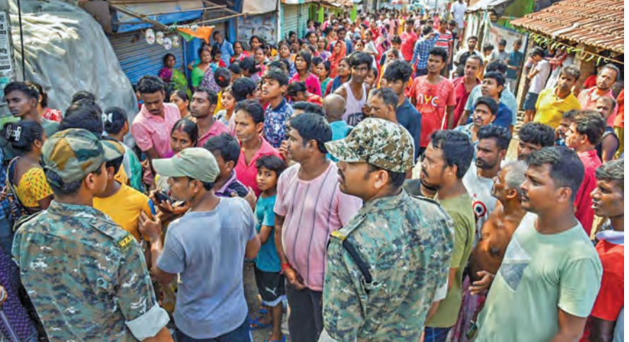
బెంగాల్ దక్షిణ 24 పరగణాల జిల్లాలోని ఫాల్గా ప్రాంతంలో శనివారం రిపోలింగ్ సందర్భంగా టిఎంసి అభ్యర్థికి వ్యతిరేకంగా అందోళ్ల చేస్తున్న ఓటర్లు

>>> కోట్ల లావాదేవీలు సమోదయాన్ని, ఇది యుపిఐ దశాబ్ది కాల ప్రయాణంలో అత్యధిక నెలవారీ లావాదేవీల పరిమాణం. 2025 క్యాలెండర్ సంవత్సర కాలంలో, యూపిఐ మొత్తం మీద సుమారు 22 వేల కోట్ల లావాదేవీలను ప్రాసెస్ చేసింది, ఇది రోజుకు నగదును దాదాపు 60 కోట్ల లావాదేవీలను సమానం. ఈ నేపథ్యంలో దేశ డిజిటల్ చెల్లింపుల్లో యూపిఐ వాటా 85 శాతం కలిగి ఉండే అధిక వినియోగం దేశవ్యాప్తంగా డిజిటల్ చెల్లింపుల విస్తృత వ్యాప్తిని, దేశ డిజిటల్ చెల్లింపుల వ్యవస్థపై పౌరులు, వ్యాపారులు, వ్యాపార సంస్థలలో పెరుగుతున్న నమ్మకాన్ని ప్రతిబింబిస్తుందని ఆర్థిక మంత్రిత్వ శాఖ వెల్లడించింది.