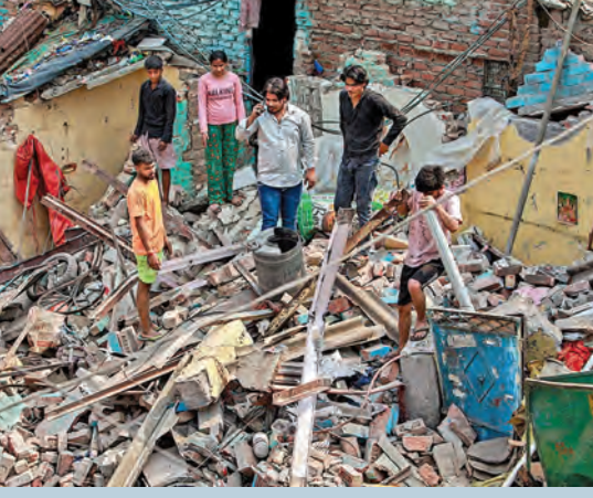
శనివారం న్యూఢిల్లీలోని పజీర్ పూర్ పారిశ్రామిక ప్రాంతంలో ఆకస్మికాలను కూల్చివేసిన ఢిల్లీ మున్సిపల్ కార్పొరేషన్ సిబ్బంది