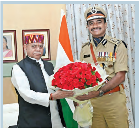
శనివారం లోక్భవన్లో గవర్నర్ శివప్రతాప్ శుక్లాతో భేటీ అయిన డిజిపి సివి ఆనంద్