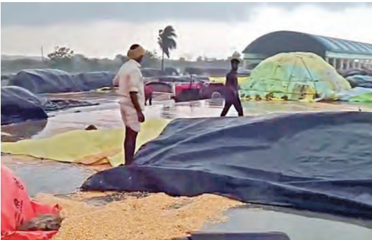
నాగర్ కర్నూలులో కల్లంలో అకాల వర్షానికి తడిసిన ధాన్యం

తడిసిముద్దయిన వరి, మొక్కజొన్న నేలకొరిగిన విద్యుత్ స్తంభాలు, భారీ వృక్షాలు ధాన్యం కొనుగోలు కేంద్రాల్లో ఇద్దరు రైతులు మృతి