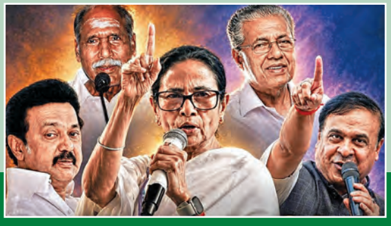
న్యూఢిల్లీ, మే 3: పశ్చిమబెంగాల్, తమిళనాడు, కేరళ, అసోం రాష్ట్రాలతోపాటు కేంద్ర పాలిత ప్రాంతం పుదుచ్చేరి అసెంబ్లీ ఓట్ల లెక్కింపు సోమవారం జరుగనుంది. ఉదయం 8గం.లకు ప్రారంభం కానుంది.వారాల తరబడి సాగిన ప్రవాహాలు,

బెంగాల్, తమిళనాడు, కేరళ, పుదుచ్చేరి, అసోంలో ఉ. 8 గం.కు ఓట్ల లెక్కింపు ఆరంభం కాంటింగ్ కేంద్రాల వద్ద ఇసి పకడ్బందీ ఏర్పాట్లు విజయోత్సవాలు, ర్యాలీలపై సిషేధం