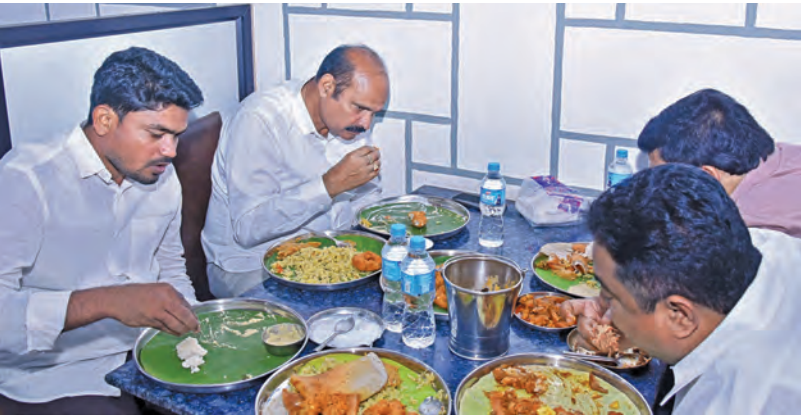
అధికారం కడపలోని ఓ హోటల్ లో సామాన్యులతో అల్పాహారం చేస్తున్న మంత్రి కొలను పార్థసారథి