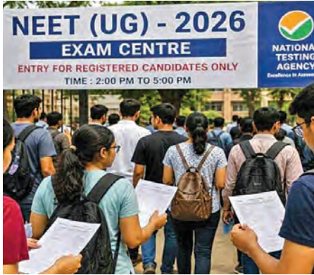
NEET (UG) - 2026 EXAM CENTRE ENTRY FOR REGISTERED CANDIDATES ONLY TIME : 2:00 PM TO 5:00 PM NATIONAL TESTING AGENCY