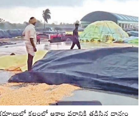
నాగర్ కర్నూలులో కల్లంలో అకాల వర్షానికి తడిసిన ధాన్యం

తడిసిముద్దయిన వరి, మొక్కజొన్న నేలకొరిగిన విద్యుత్ స్తంభాలు, భారీ వృక్షాలు ధాన్యం కొనుగోలు కేంద్రాల్లో ఇద్దరు రైతులు మృతి