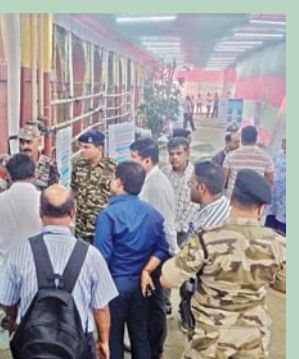
కోల్ కతాలోని ఓ కౌంటింగ్ కేంద్రంలో ఆదివారం ఏర్పాట్లను పరిశీలిస్తున్న అధికారులు

అరోపణలు, వాగ్దానాలు, ర్యాలీలతో ప్రారంభమై నేడు కౌంటింగ్ ముగియనుంది. ఉత్సాహంతో నాటికీయతకు తెరపడనుంది. ఐదు రాష్ట్రాల్లో విభిన్న రాజకీయ పరిణామాలు, ఐదు విభిన్న చోటీలు. ఎనిమిది >>2