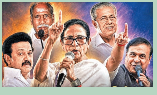
న్యూఢిల్లీ, మే 3: పశ్చిమబెంగాల్, తమిళనాడు, కేరళ, అసోం రాష్ట్రాలలోపాటు కేంద్ర పాలిత ప్రాంతం పుదుచ్చేరి అసెంబ్లీ ఓట్ల లెక్కింపు సోమవారం జరుగుతుంది. ఉదయం 8గం.లకు ప్రారంభం కానుంది.వాలూ తరబడి సాగిన ప్రచారాలు,

బెంగాల్, తమిళనాడు, కేరళ, పుదుచ్చేరి, అసోంలో ఊ. 8 గం.కు ఓట్ల లెక్కింపు ఆరంభం కౌంటింగ్ కేంద్రాల వద్ద ఇసి పకడ్బందీ ఏర్పాట్లు విజయోత్సవాలు, ర్యాలీలపై నిషేధం