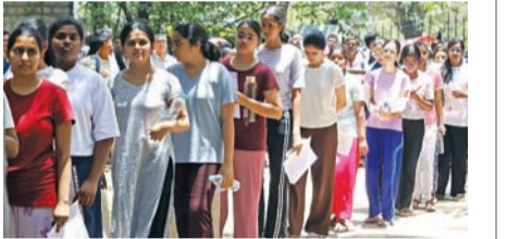
హైదరాబాద్ లో ఓ పరీక్షా కేంద్రం వద్ద విద్యార్థులు

ప్రశాంతంగా నీట్ ఫిజిక్స్ ప్రశ్నలు కలిసం.. మిగిలినవి సాధారణం! ఎపిలోనూ పరీక్ష ప్రశాంతం