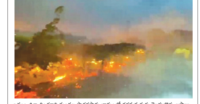
ఖమ్మం జిల్లా చింతకాని మండల పాతర్లపాడు గ్రామంలో దగ్ధమవుతున్న మొక్కజొన్న బస్తాలు