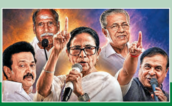
న్యూఢిల్లీ, మే 3: పశ్చిమబెంగాల్, తమిళనాడు, కేరళ, అసోం రాష్ట్రాలతోపాటు కేంద్ర పాలిత ప్రాంతం పుదుచ్చేరి అసెంబ్లీ ఓట్ల లెక్కింపు సోమవారం జరుగనుంది. ఉదయం 8గం.లకు ప్రారంభం కానుంది. వారాల తరబడి సాగిన ప్రవాహాలు, ఆరోపణలు, వాగ్దానాలు, ర్యాలీలతో ప్రారంభమై నేడు కౌంటింగ్ తో ముగియనుంది. ఉత్కలభరితమైన నాటకీయతకు తెరపడనుంది. ఐదు రాష్ట్రాల్లో విభిన్న రాజకీయ పరిణామాలు, ఐదు విభిన్న పోటీలు. ఎనిమిది >>2

బెంగాల్, తమిళనాడు, కేరళ, పుదుచ్చేరి, అసోంలో ఉ. 8 గం.కు ఓట్ల లెక్కింపు ఆరంభం కాంటింగ్ కేంద్రాల వద్ద ఇసి పకడ్బందీ ఏర్పాట్లు విజయోత్సవాలు, ర్యాలీలపై సిషేధం