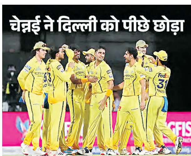
चेन्नई ने दिल्ली को पीछे छोड़ा

मुंबई को 7वीं हार का सामना करना पड़ा है। टीम 9 में से 2 मैच ही जीत सकी है। मुंबई यहां से सभी मैच जीतती है तो उसके 14 अंक होंगे। पिछले चार आईपीएल सीजन में सिर्फ एक बार कोई टीम महज 14 अंक