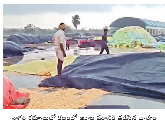
నాగర్ కర్నూలులో కల్లంలో అకాల వర్షానికి తడిసిన ధాన్యం

తడిసిముద్దయిన వరి, మొక్కజొన్న నేలకొరిగిన విద్యుత్ స్తంభాలు, భారీ వృక్షాలు ధాన్యం కొనుగోలు కేంద్రాల్లో ఇద్దరు రైతులు మృతి