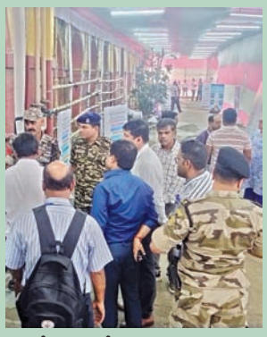
కోల్కతాలోని ఓ కౌంటింగ్ కేంద్రంలో ఆదివారం ఏర్పాట్లను పరిశీలిస్తున్న అధికారులు

ఆరోపణలు, వాగ్దానాలు, ర్యాలీలతో ప్రారంభమై నేడు కౌంటింగ్ తో ముగియనుంది. ఉత్సాహంతో మైసూరు నాటికీ తరవడం వచ్చింది. ఐదు రాష్ట్రాల్లో విభిన్న రాజకీయ పరిణామాలు, ఐదు విభిన్న పోటీలు. ఎనిమిది >>2