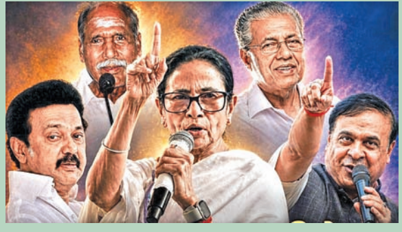
న్యూఢిల్లీ, మే 3: పశ్చిమబెంగాల్, తమిళనాడు, కేరళ, అసోం రాష్ట్రాలతోపాటు కేంద్ర పాలిత ప్రాంతం పుదుచ్చేరి అసెంబ్లీ ఓట్ల లెక్కింపు సోమవారం జరుగునుంది. ఉదయం 8గం.లకు ప్రారంభం కానుంది.వారాల తరబడి సాగిన ప్రచారాలు,

బెంగాల్, తమిళనాడు, కేరళ, పుదుచ్చేరి, అసోంలో ఉ. 8 గం.కు ఓట్ల లెక్కింపు ఆరంభం కౌంటింగ్ కేంద్రాల వద్ద ఇసి పకడ్బందీ ఏర్పాట్లు విజయోత్సవాలు, ర్యాలీలపై నిషేధం