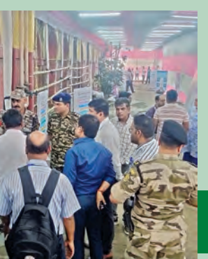
కోల్ కతాలోని ఓ కౌంటింగ్ కేంద్రంలో ఆదివారం ఏర్పాట్లను పరిశీలిస్తున్న అధికారులు

ప్రశాంతంగా నీట్ ఫిజిక్స్ ప్రశ్నలు కఠినం.. మిగిలినవి సాధారణం! ఎపిలోనూ పరీక్ష ప్రశాంతం