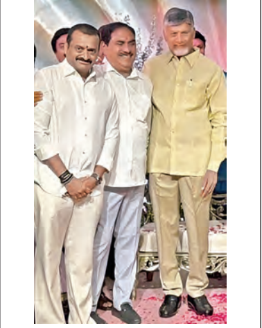
హైదరాబాద్లో ఆదివారం జరిగిన ఓ కార్మకమంలో ఎపి సిఎం చంద్రబాబు, ఎర్రబెల్లి దయాకర్ రావు