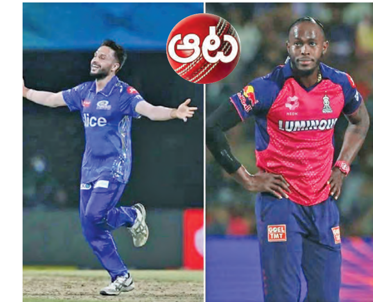
ఐపీఎల్ వల్ల క్రికెట్ లో అవుతుందని వాపోతున్నారు. ఐపీఎల్లో బౌలర్లకు అవకాశం తక్కువగా ఉందని ఆందోళన వ్యక్తం చేశారు. అయినా అవకాశం వచ్చినప్పుడు తామే తీసుకోమని బౌలర్లు చాటిచెబుతున్నారు

ఇండియన్ ప్రీమియర్ లీగ్. ఇది కాసుల క్రికెట్, భారీ ఎంటర్టైన్మెంట్ సిక్వెన్స్ ఈవెంట్గా మారినా? అంటే అవుననే అంటున్నారూ మాజీ క్రికెట్ దిగ్గజాలు. ముత్తయ్య మురళీధరన్ వంటి దిగ్గజాలు నోసలు చిట్టినప్పటికీ, ఐపీఎల్ వల్ల క్రికెట్ లో అవుతుందని వాపోతున్నారు. ఐపీఎల్లో బౌలర్లకు అవకాశం తక్కువగా ఉందని ఆందోళన వ్యక్తం చేశారు. అయినా అవకాశం వచ్చినప్పుడు తామే తీసుకోమని బౌలర్లు చాటిచెబుతున్నారు