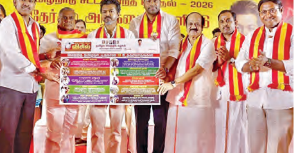
చెన్నై, మే 4: తమిళనాడు ఎన్నికల ఫలితాల్లో తమిళకాళి వెల్లి కజంగం ప్రభంజనం స్పష్టమైంది. ఆ పార్టీ టీడీ విజయ ప్రకటించిన ఎన్నికల మేనిఫెస్టో విజయానికి కీలకంగా మారింది. మహిళలు, రైతులు, యువత లక్ష్యంగా అనేక హామీలు ఇచ్చారు. 60 ఏళ్లకంటే పై ప్రతి మహిళకు నెలకు రూ.2,500 అర్హక సహాయం, ఏడాదికి ఆరు ఉచిత ఎలెక్ట్రిక్ సిలిండర్లు ఇస్తామని ప్రకటించారు. మహిళల భద్రతకు ప్రత్యేక ప్రభుత్వ శాఖ, ప్రత్యేక మహిళా కోర్టులు వంటివి టీవీకె వ్యాఖ్యానం చేసింది. యువపురుషుల ఒక సాపేక్ష బంగారు నాణెం, ఒక పట్టు బీర, తల్లిపూజ, పుట్టిన శిశువుకు బంగారు ఉంగరం ఇస్తామని హామీ ఇచ్చింది. పాఠశాల మాస్కోనీ బాలికల సంఖ్యను తగ్గించడానికి, వారి తల్లిపూజ లేదా సందర్భాలకు సంపత్నరానికి రూ.15వేలు అందజేస్తామని తెలిపింది. మహిళా స్వయం సహాయక బృందాలకు రూ.5 లక్షల వరకు ఒకేసారి అర్హక సహాయం అందిస్తామని, యువత కోసం మేనిఫెస్టోలో కీలక హామీలు విజయం పార్టీ ప్రకటించింది. 12వ తరగతి నుంచి పీహెచ్సీ స్కూలు విద్యార్థులకు రూ.20 లక్షల వరకు పూజీకల్ లేని రుణాలు ఇస్తామని హామీ ఇచ్చింది. ప్రభుత్వ నియామకాల స్థితికి ఒక పారదర్శక కాలపరిమితిని వ్యాఖ్యానం చేసింది. పట్టణప్రజలకు నెలకు రూ.4వేలు, డిప్లొమా హోల్డర్లకు రూ.2,500 నిరుద్యోగ భృతిని కూడా అందిస్తామని పేర్కొంది. నిరుద్యోగులకు, కార్మికులకు వైఫల్య శిక్షణతో పాటు ఆదాయ వనరులు సమకూరుస్తామని టీవీకె హామీ ఇచ్చింది. వైఞ్ఞ్య శిక్షణ పొందుతున్న నిరుద్యోగ పట్టణప్రజలకు నెలకు రూ.10,000, బిజెపి డిప్లొమా హోల్డర్లకు రూ.8,000 అందిస్తామని తెలిపింది. 'సీఎం పీపుల్ సర్వీస్ ఆసోసియేట్ కార్పొరేషన్లో భాగంగా గ్రామ స్కూల్లో ఐదు లక్షల మంది యువతకు ఉపాధికల్పిస్తామని ఆపార్టీ వ్యాఖ్యానంచేసింది. ఈ ఉద్యోగం