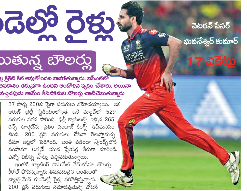
వెటర్న్ పేసర్ భువనేశ్వర్ కుమార్ 17 వికెట్లు. 37 స్కార్లు 200కు పైగా పరుగులు సమోదయ్యాయి. ఇక అరుణ్ జైట్లీ స్టేడియంలోనైతే ఒకే మ్యాచ్లో 529 పరుగుల వరద పారించి. ఢిల్లీ క్యాపిటల్స్ ఇచ్చిన 265 రన్స్ టార్గెట్ను సైతం పంజాబ్ కింగ్స్ డిఫెండ్ చేసింది. 200 ప్లస్ పరుగులు చేసినా గెలుస్తామన్న భీమా జట్లలో వెలిగింది. బంతి పడితే స్టాండ్స్లోకి పంపామా అన్నదే యువ స్టేషన్ల తీరుగా మారింది. ఎన్నో విభిన్న పాట్లు వచ్చినందుకున్నాయి. అంతటా బ్యాటింగ్ డామినేట్ గేమ్లోనూ బౌలర్లు కీల్లో పోషిస్తున్నారు. తమపదమైన బంతలతో బ్యాట్స్మెన్ గుండెలో రైళ్లు పరిగెత్తిస్తున్నారు. 200 ప్లస్ పరుగులు సమోదయ్యన్న బోటస్ లో స్కార్లు అగుస్తున్నాయి. ఈ ఐపీఎల్ సీజన్లో ఢిల్లీని 75 పరుగులతో అర్చి బీ కట్టడిచేయగలిగింది. ఇక వెటర్న్ పేసర్ భువనేశ్వర్ కుమార్, రబడ, అర్చర్, కంబోజీ, మలింగ, ప్రసిద్ధ్ కృష్ణ వంటి పేసర్లు బ్యాట్స్మెన్లకు తమ పేస్ రుచి చూపిస్తున్నారు. అరబ్బంలోనే వికెట్లు తీస్తూ తమ జట్ల విజయాల్లో కీల్ పోషిస్తున్నారు. భువనేశ్వర్ కుమార్, కంబోజీ చెట్ల 17 వికెట్లతో టాప్లో కొనసాగుతున్నారు. రబడ 16 వికెట్లు.. అర్చర్, మలింగ 15 వికెట్లు తరువాతి స్థానాల్లో