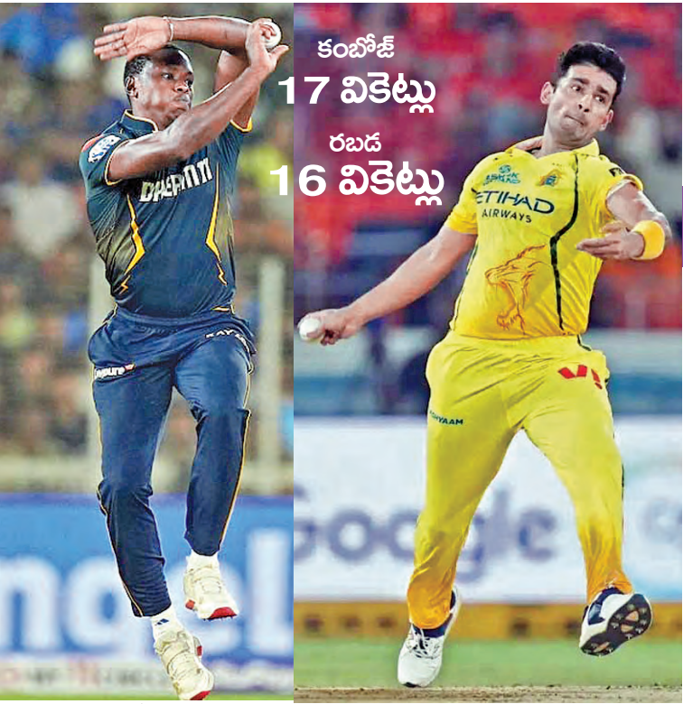
కంబోజీ 17 వికెట్లు, రబడ 16 వికెట్లు. (వార్త క్రీడా విభాగం) ఐపీఎల్ ఇది ఫుక్కు వ్యాపార వేదికగా మారినదేదీ క్రీడా నిపుణులు, అభిమానులూ అభిప్రాయాన్ని వ్యక్తం చేస్తున్నారు. క్రికెట్, వినోదం కలయికగా ఐపీఎల్ మారింది. భారీ స్కార్లు, సిక్స్లు, ఫోర్లు ఇవి మాత్రమే పేక్షకులను అలరిస్తాయి. ఇదే వ్యాపార సూత్రంగా బ్యాటింగ్ అనుకుంటే పీవీలు, ఇంఫాక్ట్