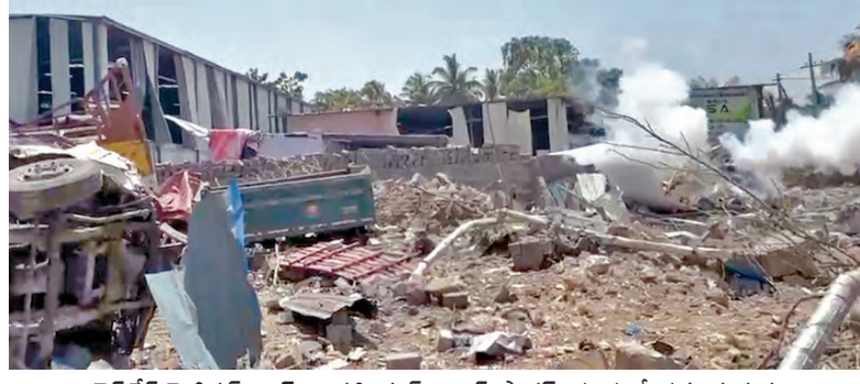
లైసెన్స్ మెడికల్ అండ్ ఇండస్ట్రియల్ యియర్ ప్రొడక్ట్ సంస్థలో ప్రమాద దృశ్యం

సరూర్ నగర్, మే 4 ప్రభాతవార్త: శివారు హైదరాబాద్లో ఒక పరిశ్రమలో భారీ పేలుడు సంభవించింది. దాదాపు కిలోమీటర్ల మేర వరకు భారీ శబ్దం రావడంతో స్థానికులు ఉలిక్కిపడ్డారు. ప్రమాదంలో భారీ ఆస్తి నష్టం జరిగింది. వైద్య అవసరాల కోసం వాడే ఆస్తి జనీతు సంబంధించిన డాక్టర్లు పేలుడు ఫుటనలో ముగ్గురు వ్యక్తులు తీవ్రంగా గాయపడగా పేలుడు దాటి ఆస్తి నష్టం సంభవించింది. ఈ సంఘటన సోమవారం పవనేడీరీఫ్ పోలీస్ స్టేషన్ పరిధిలోని జల్పల్లి విజ్ఞాపక జరిగింది. వివరాలలోకి వెళ్తే జల్పల్లి పరిధిలోని బాబా కాండా సమీపంలో వైద్య అవసరాల నిమిత్తం ఆసుపత్రులకు సరఫరా చేసే ఆస్తి జనీ సిలిందర్లు నింపే లైసెన్స్ మెడికల్ అండ్ ఇండస్ట్రియల్ యియర్ ప్రొడక్ట్ సంస్థ ఉంది. అయితే సోమవారం ఉదయం 11.30 గంటల సమయంలో ఒకసారిగా ఓ కంటైనర్ కు లీకేజీ ఏర్పడి పెద్ద శబ్దంతో పేలుడు ఆ తర్వాత