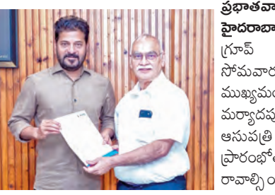
ప్రభాతవార్త ప్రధాన ప్రతినిధి హ