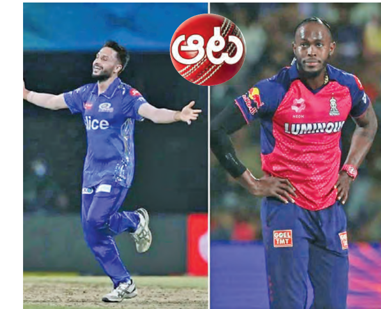
ఇండియన్ ప్రీమియర్ లీగ్. ఇది కాసుల క్రికెట్, భారీ ఎంటర్టైన్మెంట్ సిక్వెన్స్ ఈవెంట్గా మారినా? అంటే అవును అంటున్నారు మాజీ క్రికెట్ దిగ్గజాలు. ముత్తయ్య మురళీధరన్ వంటి దిగ్గజాలు నోసలు చిట్టినప్పుడు. ఐపీఎల్ వల్ల క్రికెట్ లో అవుతుందని వాపోతున్నారు. ఐపీఎల్లో బౌలర్లకు అవకాశం తక్కువగా ఉందని ఆందోళన వ్యక్తం చేశారు. అయినా అవకాశం వచ్చినప్పుడు తామే తీసుకోమని బౌలర్లు చాటిచెబుతున్నారు