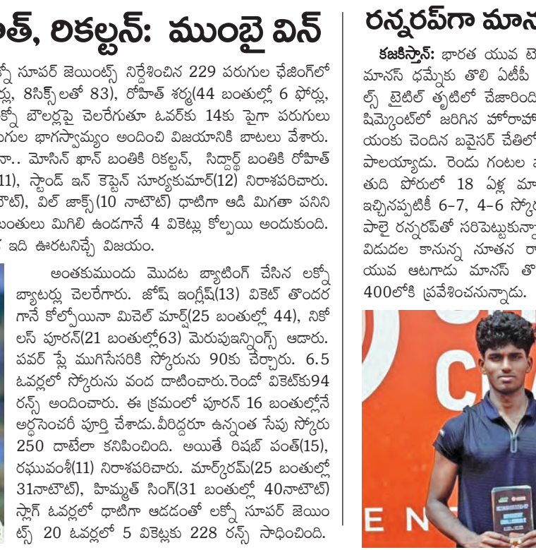
రన్నరమ్ గా మానస్ ధమ్మ. కజిన్స్: భారత యువ టెస్టిన్ సంవలనం మానస్ ధమ్మకు తొలి ఏటీటీ ఫాంజర్ సింగిల్స్ టైటిల్ తప్పిపోయింది. కజిన్స్లోని పిమ్మెంట్లో జరిగిన హోరాహోరీ పైనల్లో బెల్లె యుకు చెందిన బెన్జెన్ వేతిలో మానస్ ఓటమి పాలయ్యారు. రెండు గంటల పాటు సాగిన ఈ తుది యోధులో 18 ఏళ్ల మానస్ గజ్జి పోటీ ఇచ్చినప్పటికీ 6-7, 4-6 స్కార్డుతో పరాజితి పాలై రన్నరమ్లో సరిపెట్టుకున్నారు. సోమవారం విడుదల కానున్న మానస్ ర్యాంకింగ్లో ఈ యువ అటగాడు మానస్ తొలిసారిగా టాప్-400లోకి ప్రవేశించనున్నారు.