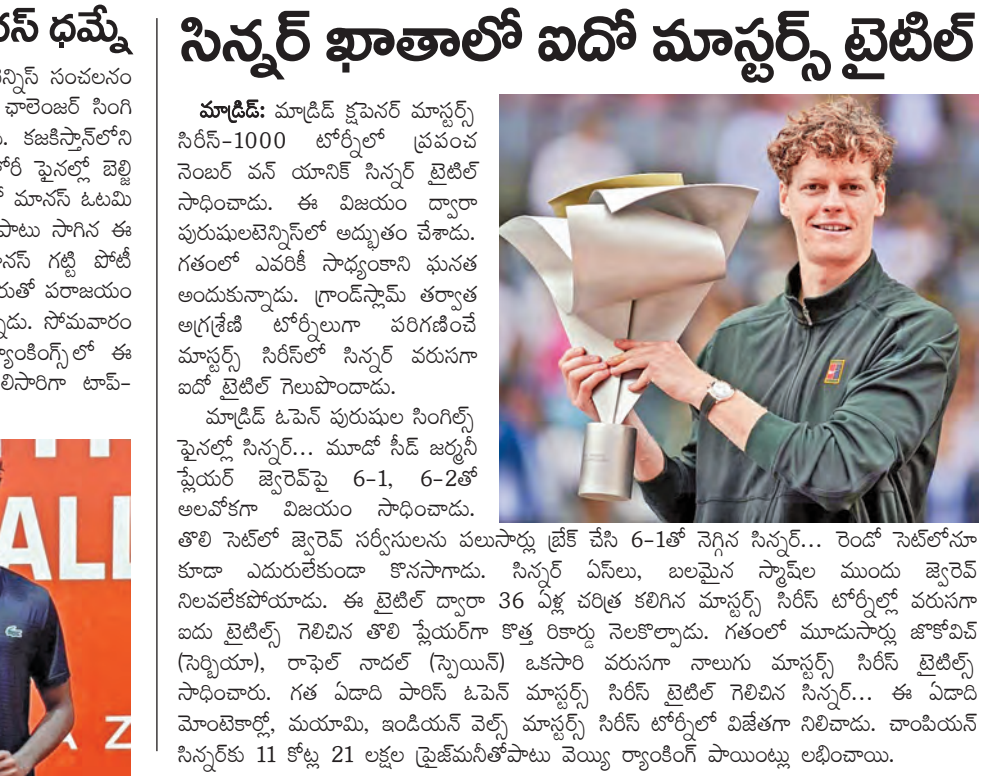
సిన్గర్ భాతాలో ఐదో మాస్టర్స్ టైటిల్. మాడ్డి: మాడ్డి క్లబ్లో మాస్టర్స్ సిరీస్-1000 టోర్నీలో ప్రపంచ నెంబర్ వన్ యానిక్ సిన్గర్ టైటిల్ సాధించారు. ఈ విజయం ద్వారా పురుషుల టెస్టిన్లో అద్భుతం చేశారు. గతంలో ఎవరికీ సాధ్యంకాని ఘనత అందుకున్నారు. గ్రాండ్స్టామ్ తర్వాత అగ్రత్రేణి టోర్నీలుగా పరిగెత్తించే మాస్టర్స్ సిరీస్లో సిన్గర్ వరుసగా ఐదో టైటిల్ గెలుపొందారు. మాడ్డి ఓపెన్ పురుషుల సింగిల్స్ పైనల్లో సిన్గర్.. మాడ్డి సిడ్ జర్నల్ స్పెషల్ జ్యూరెస్పై 6-1, 6-2తో అలవోకగా విజయం సాధించారు. తొలి సెట్లో జ్యూరెస్ సర్వీసులను వలుస్తూ ట్రెక్ చేసి 6-1తో నెగ్గిన సిన్గర్.. రెండో సెట్లోనూ కూడా ఎదురుదెబ్బకుండా కొనసాగాడు. సిన్గర్ ఫలితం, బలమైన స్ట్రాక్ల ముందు జ్యూరెస్ నిలవలేకపోయాడు. ఈ టైటిల్ ద్వారా 36 ఏళ్ల చరిత్ర కలిగిన మాస్టర్స్ సిరీస్ టోర్నీలో వరుసగా ఐదో టైటిల్ గెలిచిన తొలి స్పెషల్ గా కొత్త రికార్డు నెలకొల్పాడు. గతంలో మూడుసార్లు జోకోవీష్ (స్విట్జర్లాండ్), రాఫెల్ నాదల్ (స్విట్జర్లాండ్) ఒకసారి వరుసగా నాలుగు మాస్టర్స్ సిరీస్ టైటిల్స్ సాధించారు. గత ఏడాది పారిస్ ఓపెన్ మాస్టర్స్ సిరీస్ టైటిల్ గెలిచిన సిన్గర్.. ఈ ఏడాది మోంటెకార్లో, మయూమ, ఇండియన్ వెల్డ్ మాస్టర్స్ సిరీస్ టోర్నీలో విజేతగా నిలిచాడు. వాంషియన్ సిన్గర్కు 11 కోట్ల 21 లక్షల ప్రైవేటులోపాటు వెయ్యి ర్యాంకింగ్ పాయింట్లు లభించాయి.