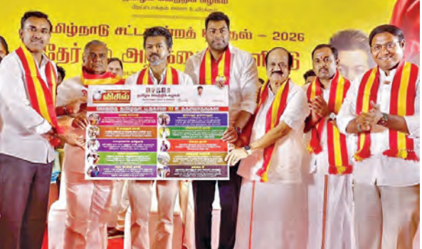
చెన్నై, మే 4: తమిళనాడు ఎన్నికల ఫలితాల్లో తమిళనాడు వెల్లె కజంగం ప్రభంజను స్పృశించింది. ఆ పార్టీ టీడీ పిఐ విజయ ప్రకటించిన ఎన్నికల మేనిఫెస్టో విజయానికి కీలకంగా మారింది. మహిళలు, రైతులు, యువత లక్ష్యంగా అనేక హామీలు ఇచ్చారు. 60 ఏళ్లకంటే పై ప్రతి మహిళకు నెలకు రూ.2,500 అర్హక సహాయం, ఏడాదికి ఆరు ఉచిత ఎలెక్ట్రిక్ సిలిండర్లు ఇస్తామని ప్రకటించారు. మహిళల భద్రతకు ప్రత్యేక ప్రభుత్వ శాఖ, ప్రత్యేక మహిళా కోర్టులు వంటివి టీడీపీకి వ్యాఖ్యానం చేసింది. యువపురుషుల ఒక సావధన బంగారు నాణెం, ఒక పట్టు బీర, తల్లిపూజ, పుట్టిన శిశువుకు బంగారు ఉంగరం ఇస్తామని హామీ ఇచ్చింది. పాఠశాల మాస్కోనీ బాలికల సంఖ్యను తగ్గించడానికి, వారి తల్లిపూజ లేదా సందర్భాలకు సంపత్నరానికి రూ.15వేలు అందజేస్తామని తెలిపింది. మహిళా స్వయం సహాయక బృందాలకు రూ.5 లక్షల వరకు ఒకేసారి అర్హక సహాయం అందిస్తామని, యువత కోసం మేనిఫెస్టోలో కీలక హామీలు విజయం పార్టీ ప్రకటించింది. 12వ తరగతి నుంచి పీహెచ్సీ స్కూలు విద్యార్థులకు రూ.20 లక్షల వరకు పూచీకత్తు లేని రుజులు ఇస్తామని హామీ ఇచ్చింది. ప్రభుత్వ నియామకాల స్థిరీకీ ఒక పారదర్శక కాలపటిమిని వ్యాఖ్యానం చేసింది. పట్టణప్రజలకు నెలకు రూ.4వేలు, డిప్లొమా హోల్డర్లకు రూ.2,500 నిరుద్యోగ భృతిని కూడా అందిస్తామని పేర్కొంది. నిరుద్యోగులకు, కార్మికులకు వైఫల్య శిక్షణతో పాటు ఆదాయ వనరులు సమకూరుస్తామని టీడీపీ హామీ ఇచ్చింది. వైఫల్య శిక్షణ పొందుతున్న నిరుద్యోగ పట్టణప్రజలకు నెలకు రూ.10,000, ఇంటి విద్యుత్ హోల్డర్లకు రూ.8,000 అందిస్తామని తెలిపింది. 'సీఎం పీపుల్ సర్వీస్ ఆసోసియేట్ కార్పొరేషన్లో భాగంగా గ్రామ స్కూల్లో ఐదు లక్షల మంది యువతకు ఉపాధికల్పిస్తామని ఆపార్టీ వ్యాఖ్యానంచేసింది. ఈ ఉద్యోగం