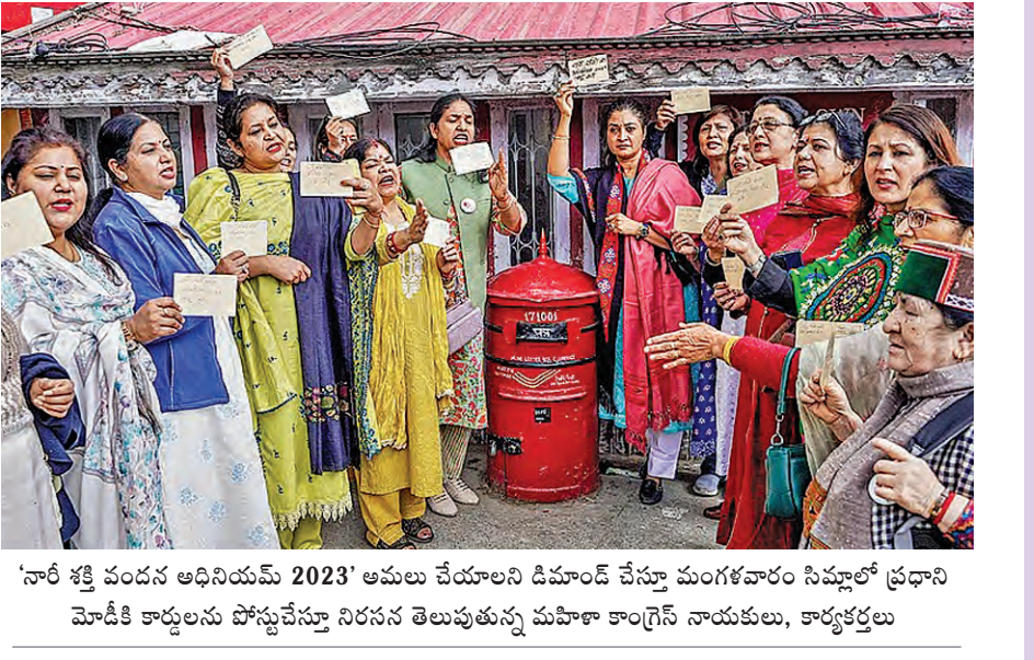
'నారీ శక్తి పంచదం ఆధినియమ్ 2023' అమలు చేయాలని డిమాండ్ చేస్తూ మంగళవారం సిహెచ్ఆర్ ప్రధాని మోడీకి కార్డులను పోస్టుచేస్తూ నిరసన తెలుపుతున్న మహిళా కాంగ్రెస్ నాయకులు, కార్యకర్తలు