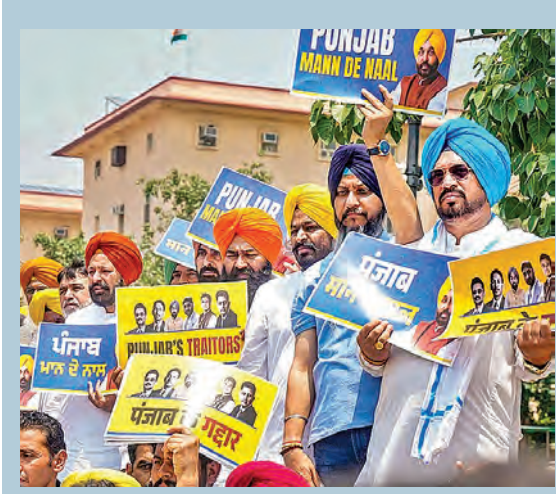
మంగళవారం న్యూఢిల్లీలో ప్రకారంలో నిరసన ప్రదర్శన జరిపిన పంజాబ్ ఆమ్ ఎమ్మెల్యేలు