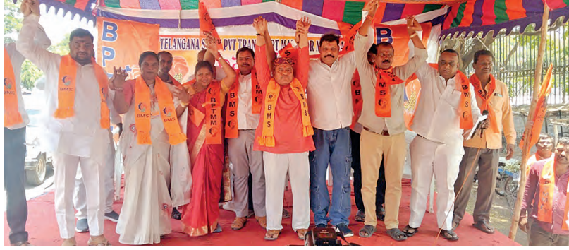
మంగళవారం నిర్వహించిన ధర్నాల్లో అభివాదం చేస్తున్న బిపిటియంయం నేతలు

నుంచి ప్రారంభించడానికి షెడ్యూల్ ను రాష్ట్రంలో 2026-27 విద్యా సంవత్సరానికి సంబంధించి సోమవారం జారీ చేసిన విషయం తెలిసింది. ఈ నెల 31 వరకు దరఖాస్తులను స్వీకరించనున్నట్లు అడ్మిషన్ షెడ్యూల్ ను ఇంటర్ బోర్డు కార్యదర్శి ఆధిపాతి అధినేత సోమవారం విడుదల చేశారు. ఈ సర్క్యులర్ తాత్కాలికంగా నిలిపివేస్తున్నట్లు ఇంటర్ బోర్డు కార్యదర్శి మంగళవారం ఒక ప్రకటనలో తెలిపారు. సవరించిన సూచనలతో త్వరలో అడ్మిషన్ షెడ్యూల్ జారీ చేయబడుతుంది ప్రకటించారు. రాష్ట్రంలోని ప్రభుత్వ, ప్రైవేటు జూనియర్ కాలేజీల్లో 2026-27 విద్యా సంవత్సరంలో ఇంటర్ అడ్మిషన్లను ఈ నెల 8