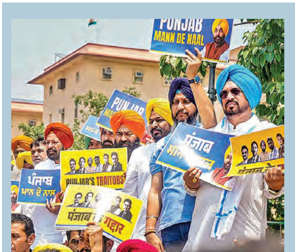
మంగళవారం న్యూఢిల్లీలో ప్రకాశులతో నిరసన ప్రదర్శన జరిపిన పంజాబ్ ఆమ్ ఎమ్మెల్యేలు