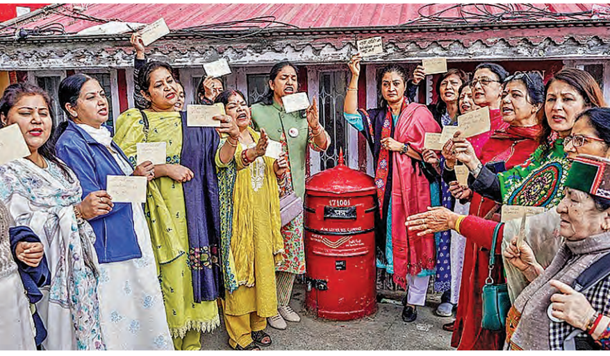
'నారీ శక్తి వందన ఆధినియమ్ 2023' అమలు చేయాలని డిమాండ్ చేస్తూ మంగళవారం సిహెచ్ ప్రధాని మోడీకి కార్డులను పోస్టుచేస్తూ నిరసన తెలుపుతున్న మహిళా కాంగ్రెస్ నాయకులు, కార్యకర్తలు