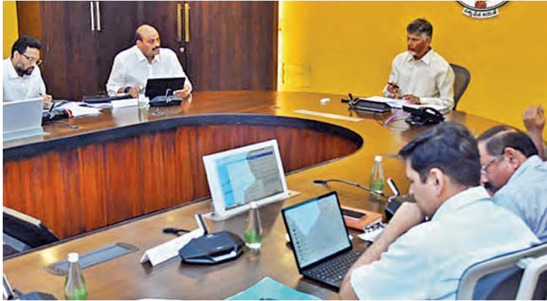
బుధవారం సచివాలయంలో జరిగిన 17వ ఎన్ఐపిబి సమావేశంలో సిఎం చంద్రబాబు

విజయవాడ, మే 6: ప్రభాతవార్త ప్రతినిధి: రాష్ట్రంలో పెట్టుబడులకు సంబంధించి వచ్చిన ప్రతి ప్రతిపాదనా ఒప్పందంగా మారాలని ఏపీ చంద్రబాబు అన్నారు. ఆయా పెట్టుబడిదారీ సంస్థలతో కుదుర్చుకున్న ప్రతి ఒప్పందం గ్రౌండ్ కావాలి అన్నారు. అలా ప్రతి ఒప్పందం పెట్టుబడిగా రూపొందించడం చెబుతున్నారు. ముఖ్యంగా మన రాష్ట్రానికి మరో భారీ పెట్టుబడి వస్తోందన్నారు. విశాఖలో రిలయన్స్ సంస్థ 1,08,010 కోట్లతో డేటా సెంటర్ ఏర్పాటుకు ముందుకు వచ్చిందన్నారు. రాష్ట్రస్థాయి పెట్టుబడుల ప్రోత్సాహక బోర్డు సమావేశం సీఎం చంద్రబాబు అధ్యక్షతన