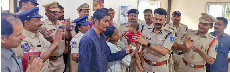
పాపను తల్లిదండ్రులకు అప్పజెప్పిన పోలీసులు