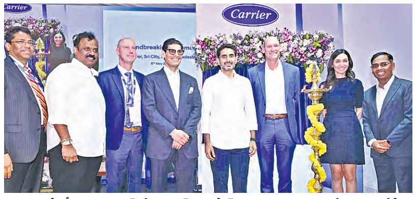
బుధవారం శ్రీసీటీ పాలకూడ పార్క్ లో క్యారియర్స్ లిఫ్ట్ జెనరేటర్ యూనిట్ కు శంకుస్థాపన చేసిన మంత్రి లోకేశ్

వేగంగా విత్తన నరఫరా: సిఎం విజయవాడ మే 6 ప్రభాతవార్త ప్రతినిధి: రైతులకు ఈ యేడాది మే 15 నుంచే సాగునీరు అందించనున్న దృష్ట్యా రాష్ట్రంలో వేగంగా విత్తన నరఫరా చేయాలని ముఖ్యమంత్రి చంద్రబాబు నాయుడు వ్యవసాయ శాఖకు దిశానిర్దేశం చేశారు. విత్తనాల నరఫరా కోసం రూ. 200 కోట్లు కేటాయించాలని ఆయన ఆదేశాలు జారీ చేశారు. సచివాలయంలో బుధవారం ఆయన రాష్ట్రంలో డాక్టర్లు, అరటి, పొగాకు, ఆయిల్ పామ్ తదితర పంటల కొనుగోళ్లపై సీఎం వ్యవసాయ, ఉద్యాన శాఖలతో సమీక్ష నిర్వహించారు. ఈ సమీక్షకు మంత్రి కె.ఆవ్వెన్నాయుడు, వ్యవసాయ, ఉద్యాన శాఖ ఉన్నతాధికారులు హాజరయ్యారు. మార్కెట్ డిమాండ్ కు అనుగుణంగా రైతులు పండించే పంటలకు ధరలు దక్కేలా చూడాలని సీఎం స్పష్టం చేశారు. ట్రేసెటిటి, సెల్ఫీ కేమ్స్ ద్వారా పంటలకు మెరుగైన ధర లభించే అవకాశం ఉంటుందని ముఖ్యమంత్రి పేర్కొన్నారు. రైతుకు రాజసౌలీగా 82 లక్షల నాణ్యమైన పంట దిగుబడులు వచ్చేందుకు కృషి చేయాలని సూచించారు. మరిన్ని పంటలను ప్రకృతి సేద్యం విధానంలో వివిధ పంటలను సాగు చేస్తే రైతులకు మరింత ప్రయోజనం కలుగుతుందన్నారు. సేంద్రీయసాగు కంపోస్టు ఎరువును >>2