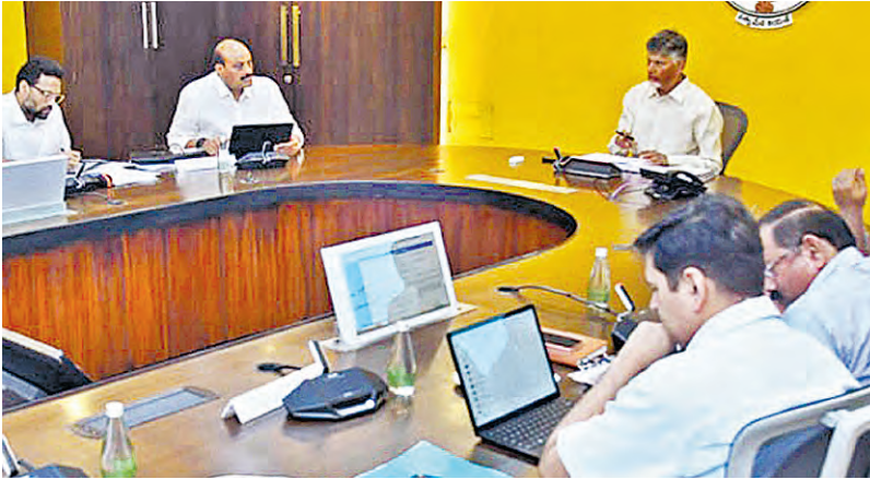
బుధవారం సచివాలయంలో జరిగిన 17వ ఎన్ఐపిబి సమావేశంలో సిఎం చంద్రబాబు

విజయవాడ, మే 6 ప్రభాతవార్త ప్రతినిధి: రాష్ట్రంలో పెట్టుబడులకు సంబంధించి వచ్చిన ప్రతి ప్రతిపాదనా ఒప్పందంగా మారాలని ప్రతి చంద్రబాబు అన్నారు. ఆయా పెట్టుబడిదారీ సంస్థలతో కుదుర్చుకున్న ప్రతి ఒప్పందం గ్రౌండ్ కావాలి అన్నారు. అలా ప్రతి ఒప్పందం పెట్టుబడిగా రూపొందించడం చెందాలన్నారు. ముఖ్యంగా మన రాష్ట్రానికి మరో భారీ పెట్టుబడి వస్తోందన్నారు. విశాఖలో రిలయన్స్ సంస్థ రూ. 1,08,010 కోట్లతో డేటా సెంటర్ ఏర్పాటుకు ముందుకు వచ్చిందన్నారు. రాష్ట్రస్థాయి పెట్టుబడుల ప్రోత్సాహక బోర్డు సమావేశం సీఎం చంద్రబాబు అధ్యక్షతన