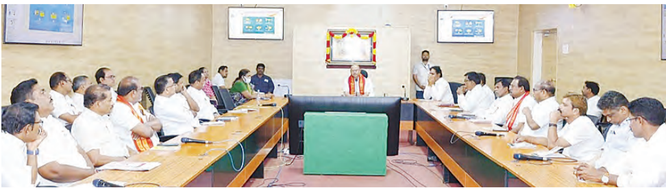
శ్రీశైలం ప్రాజెక్టు మే 6, ప్రభాకర్ వార్త : శ్రీశైలం ప్రాజెక్టులోని ప్రతి ఉద్యోగి కూడా భక్తుల సౌకర్యాల కల్పననే ప్రధాన లక్ష్యంగా విధులు నిర్వహించాలి.