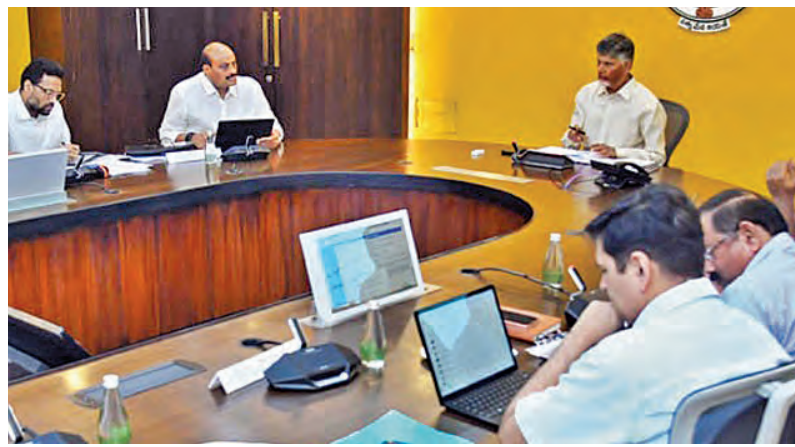
బుధవారం సచివాలయంలో జరిగిన 17వ ఎన్ఎఫ్ఐ సమావేశంలో సిఎం చంద్రబాబు

విజయవాడ,మే 6 ప్రభాతవార్తా ప్రతినిధి: రాష్ట్రంలో పెట్టుబడులకు సంబంధించి వచ్చిన ప్రతి ప్రతిపాదనా ఒప్పందంగా మారాలని ఏపీ చంద్రబాబు అన్నారు. ఆయా పెట్టుబడిదారి సంస్థలతో కుదుర్చుకున్న ప్రతి ఒప్పందం క్రాంట్ కావాలి అన్నారు. అలా ప్రతి ఒప్పందం పెట్టుబడిగా రూపొందించాలి చెప్పారు. ముఖ్యంగా మన రాష్ట్రానికి మరో భారీ పెట్టుబడి వస్తోందన్నారు. విశాఖలో రిలయన్స్ సంస్థ రూ. 1,08,010 కోట్లతో డేలా సెంటర్ ఏర్పాటుకు ముందుకు వచ్చిందన్నారు. రాష్ట్రస్థాయి పెట్టుబడుల ప్రోత్సాహక బోర్డు సమావేశం సీఎం చంద్రబాబు అధ్యక్షతన