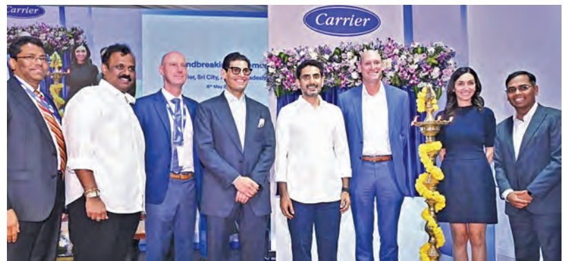
బుధవారం శ్రీసిటీ పారిశ్రామిక పార్క్లో క్యార్యర్స్, రిఫ్రిజరేటర్ యూనిట్లకు శంకుస్థాపన చేసిన మంత్రి లోకేశ్

వేగంగా విత్తన నరభరా: సిఎం విజయవాడ మే 6 ప్రభాతవార్తా ప్రతినిధి: రైతులకు ఈ యేడాది మే 15 నుంచే సాగునీరు అందించనున్న దృష్ట్యా రాష్ట్రంలో వేగంగా విత్తన నరభరా చేయాలని ముఖ్యమంత్రి చంద్రబాబు నాయుడు వ్యవసాయ శాఖకు దిశానిర్దేశం చేశారు. విత్తనాల నరభరా కోసం రూ.200 కోట్లు కేటాయించాలని ఆయన ఆదేశాలు జారీ చేశారు. సచివాలయంలో బుధవారం ఆయన రాష్ట్రంలో ధాన్యం, అరటి, పొగాకు, అయిల్ పామ్ తదితర పంటల కోనుగోళ్లపై సీఎం వ్యవసాయ, ఉద్యాన శాఖలతో సమీక్ష నిర్వహించారు. ఈ సమీక్షకు మంత్రి కె.ఆచార్యులు, వ్యవసాయ, ఉద్యాన శాఖ ఉన్నతాధికారులు హాజరయ్యారు. మార్కెట్ డిమాండ్ కు అనుగుణంగా రైతులు పండించే పంటలకు ధరలు దక్కాలా చూడాలని సీఎం స్పష్టం చేశారు. క్రేస్ బిల్డింగ్, సర్టిఫికేషన్ ద్వారా పంటలకు మెరుగైన ధర లభించే అవకాశం ఉంటుందని ముఖ్యమంత్రి పేర్కొన్నారు. రైతులకు లాభసాటిగా ఉండేలా నాణ్యమైన నందు దిగుబడులు వచ్చేందుకు కృషి చేయాలని సూచించారు. మరిన్ని పంటలను ప్రకృతి సేద్యం విధానంలో వివిధ పంటలను సాగు చేస్తే రైతులకు మరింత ప్రయోజనం కలుగుతుందన్నారు. సెంట్రీయలసాగుకు కంపోస్టు ఎరువును >>>