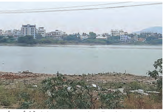
గ్రామీణ నీటిపారుదల శాఖ అధికారులు చెబుతున్నారు. అయ్యప్ప నేని చెరువు సుందరీకరణ వసులు అగిపోవడానికి రెవెన్యూ, గ్రామ పంచాయతీ అధికారులు నిర్లక్ష్యంతో పాటు గ్రామీణ నీటిపారుదల శాఖ అధికారులు అలసత్వం కొట్టకొచ్చినట్లు కనబడుతోంది.

ను అడ్డుతంగా సుందరీకరించి వీధి దీపాలు, బల్బులు, రన్విన్ గ్రాఫ్, వాకింగ్ గ్రాఫ్ తదితర సౌకర్యాలు సమకూరే అవకాశం ఉంటుంది. అయినా కూడా సంబంధిత అధికారులు పట్టించుకోవడం లేదు. ఈ ప్రక్రియ పూర్తి అయితే ఈ చెరువు నుంచి ట్రోబ్యంట్ పథకం ద్వారా నీటిని శుద్ధి చేసి చెరువులోకి వదిలే అవకాశం వచ్చింది. మన జిల్లాకు పీలేరు అయ్యప్పనేని చెరువు ట్రోబ్యంట్ పథకానికి ఎంపిక చేశారు. ఇదే జరిగితే రూ. 50 లక్షల వ్యయంతో ఈ వసులు ప్రారంభించే అవకాశం ఉంటుంది. ట్రోబ్యంట్ వసులు పూర్తయితే మురికి కూపంలో ఉన్న అయ్యప్ప నేని చెరువు నీరు శుద్ధపరిచి అన్ని అవసరాలకు వినియోగించుకునే అవకాశం ఉంటుంది. తద్వారా పర్యావరణ పరిరక్షణ కూడా సాధ్యమవుతుంది. ఇంత అవకాశం ఉన్నా కూడా సంబంధిత శాఖ అధికారులు ఏమాత్రం ఆసక్తి కనబడవకుండా నిర్లక్ష్యం వహిస్తున్నారు. చెరువును పూర్తిస్థాయిలో సర్వే నిర్వహించి హద్దులు గుర్తిస్తామని రెవెన్యూ అధికారులు చెబుతుండగా.. ఇదే చెరువును పూర్తిస్థాయిలో సుందరీకరణ చేసి అభివృద్ధి పరచాల్సిన పంచాయతీ అధికారులు ఎత్తకోపాడంతో ట్రోబ్యంట్ ప్రాజెక్టు ప్రారంభించలేమని అధికారులు అలసత్వం కొట్టకొచ్చినట్లు కనబడుతోంది.