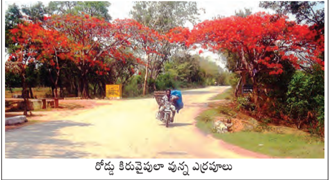
రోడ్డు కిరువైపులా పున్న ఎర్రపూలు

చౌడేపల్లి, మే 6 ప్రభాతవార్త ప్రకృతి పురివిహారే కానీ ఆనాటిదింటే మనసులకు వందగే...నిండు వేసవిలో రోడ్డుకిరువైపులా ఎర్రపూలు పూసిన చెట్లు ప్రకృతి ప్రేమలకు కనువిందు చేస్తున్నాయి. చౌడేపల్లి-పుంగనూరు ప్రధాన రహదారిలో చింతమూలపల్లి వద్ద విరగ్గాసిన మెహర్(ఎర్ర)పూలు చెట్లను మనం చూస్తున్నాం. " కొంత సేపు కూర్చోని వెళ్ళొప్పుగా " అన్నట్లు ఈ చెట్లు వాహనచోదకులను పలకరిస్తున్నాయి.