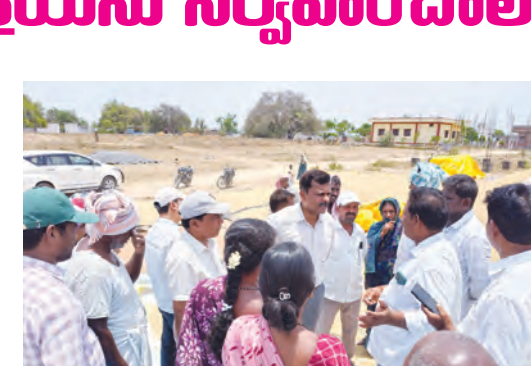
రైతులతో మాట్లాడుతున్న జిల్లా అదనపు కలెక్టర్