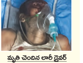
మృతి చెందిన లారీ డ్రైవర్