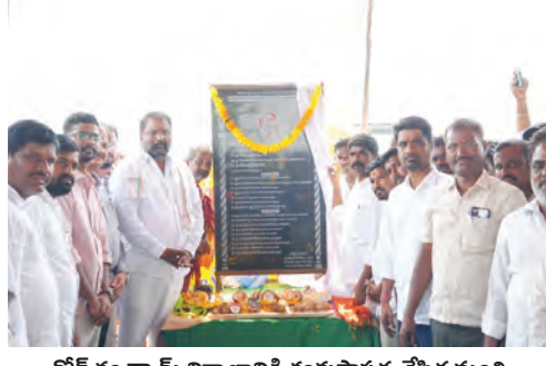
రోడ్ కం డ్యామ్ నిర్మాణానికి శంకుస్థాపన చేసిన మంత్రి