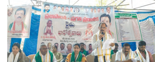
రైతు వారోత్సవాలలో మాట్లాడుతున్న నాయకులు

దేవరకల్, మే 6 ప్రభాతవార్త: ప్రజా పాలన ప్రగతి ప్రజాళికలో భాగంగా రైతు వారోత్సవాలను సోమవారం దేవరకల్లో మండల కేంద్రంలోని మార్కెట్ యార్డులో మార్కెట్ అధికారులు, సహకార శాఖ ఆధ్వర్యంలో ఘనంగా నిర్వహించారు. ఈ సందర్భంగా అధికారులు మాట్లాడుతూ రైతుల సంక్షేమం, ఆదాయ వృద్ధి, లక్ష్య గుంక ప్రభుత్వం నుండి పథకాలను అమలు చేస్తుండగా వాటి వివరాలను ఈ వారోత్సవాల ద్వారా రైతులకు చేరవేస్తున్నారు. విత్తనాల ఎంపిక ఎరువుల వినియోగం వంటల సంరక్షణ సీటి నిర్వహణ వంటి అంశాలపై ప్రత్యేక శిక్షణలు కూడా ఇస్తున్నారు. ప్రభుత్వం రైతు సంక్షేమం కోసం చేపడుతున్న రైతు భరోసా వినూత్న కార్యక్రమాల అమలు చేస్తుందని తెలిపారు. యూరియా వాడకాన్ని తగ్గించాలని, రోమిలు తప్పకుండా కొనుగోలు చేసిన విత్తనాలను తీసుకోవాలని, పంట మార్పిడి చేయాలని, జీవన ఎరువులు నాణ్యతగా, యూరియా లో తెలంగాణ సోనా డోష్ట రకం మేస్తూ భూమి సాన్ని పెంపొందించేలా వ్యవసాయాన్ని చేయాలని చెప్పడం జరిగింది. ఈ సందర్భంగా అధికారులు ప్రజాప్రతినిధులు రైతులతో సేరుగా మమేష్వై వారి సమన్వయం తెలుసుకొని పరిష్కారానికి చర్యలు చేపడుతున్నారు. రైతులు సాంకేతికతను అంగీకరించి అధిక చింపబడుతున్న సాధించాలని పిలుపునిచ్చారు. సహకార బ్యాంక్ అధికారులు దమయంతి మరియు యూనిఫ్డ్ మాట్లాడుతూ సహకార బ్యాంకులు గ్రామీణ ప్రాంతాల్లో రైతులకు సులభంగా వ్యవసాయ రుణాలు అందిస్తూ