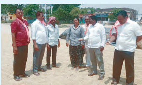
వల కొనుగోలు కేంద్రాన్ని సందర్శిస్తున్న బిఆర్ఎస్ నాయకులు

ధన్వాడ, మే 6 ప్రభాతవార్త : ధన్వాడ మండలంలోని మందిపల్లి పట్టణ కొనుగోలు కేంద్రాన్ని బిఆర్ఎస్ నాయకులు సందర్శించి అక్కడి పరిస్థితులను పరిశీలించారు. ఈ సందర్భంగా కేంద్రంలో గన్ని బ్యాగుల కొరత, పట్టణ కొనుగోలులో అలస్యం వంటి సమస్యలు తీవ్రంగా ఉన్నాయని ఆగ్రహం వ్యక్తం చేశారు. బిఆర్ఎస్ నాయకులు మాట్లాడుతూ తమ పార్టీ హయాంలో పట్టణ కొనుగోలు సహజంగా సాగడం, రైతులు ఇలాంటి ఇబ్బందులను ఎదుర్కొన్నారని పరిస్థితి రాతేదీని పేర్కొన్నారు. ప్రస్తుతం కాంగ్రెస్ ప్రభుత్వంలో నిర్వహణ లోపాల వల్ల రైతులు తీవ్ర ఇబ్బందులు పడుతున్నారని విమర్శించారు. అలాగే రైతులు గంటల కొద్దీ ఎదురుమాతాల్ని వర్తించి, గన్ని బ్యాగులు లేక పట్టణ నిల్వ ఉందిపోతున్నాయని తెలిపారు. ఈ పరిస్థితిని వెంటనే సరిచేసి కొనుగోలు ప్రక్రియను వేగవంతం చేయాలని అధికారులను డిమాండ్ చేశారు.