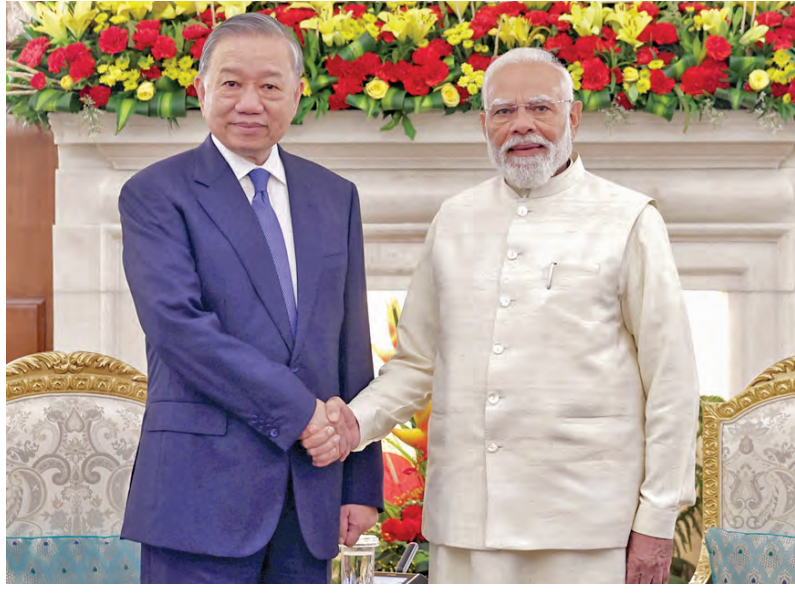
బుధవారం న్యూఢిల్లీలో ప్రధాన మంత్రితో భేటీ అయిన వియత్నాం అధ్యక్షుడు టో లాం