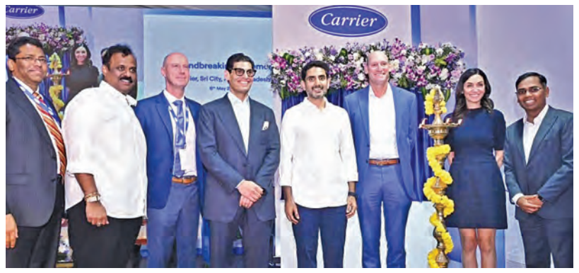
బుధవారం శ్రీసీటీ పారిశ్రామిక పార్క్లో క్యార్యర్, రిస్కెజర్బర్ యూనిట్కు శంకుస్థాపన చేసిన మంత్రి లోకేశ్