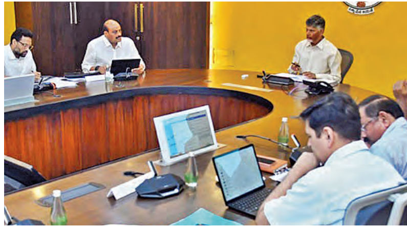
బుధవారం సచివాలయంలో జరిగిన 17వ ఎన్ఎఫ్ఐ సమావేశంలో సిఎం చంద్రబాబు

విజయవాడ, మే 6 ప్రభాతవార్త ప్రతినిధి: రాష్ట్రంలో పెట్టుబడులకు సంబంధించి వచ్చిన ప్రతి ప్రతిపాదనా ఒప్పందంగా మారాలని ఏపీ చంద్రబాబు అన్నారు. ఆయా పెట్టుబడిదారీ సంస్థలతో కుదుర్చుకున్న ప్రతి ఒప్పందం క్రౌండ్ కావాలి అన్నారు. అలా ప్రతి ఒప్పందం పెట్టుబడిగా రూపొందించాలని చెప్పారు. ముఖ్యంగా మన రాష్ట్రానికి మరో భారీ పెట్టుబడి వస్తోందన్నారు. విశాఖలో రిలయన్స్ సంస్థ రూ. 1,08,010 కోట్లతో డేటా సెంటర్ ఏర్పాటుకు ముందుకు వచ్చిందన్నారు. రాష్ట్రస్థాయి పెట్టుబడుల ప్రోత్సాహక బోర్డు సమావేశం సీఎం చంద్రబాబు అధ్యక్షతన