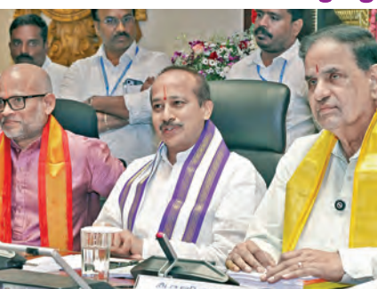
బుధవారం మీడియాకు వివరిస్తున్న చైర్మన్, ఇ.ఎ. అదనపు ఇ.ఎ.