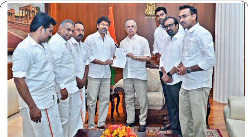
బుధవారం చెన్నైలో తమిళనాడు గవర్నరు కరిసిన డి.వి.ఎ.లతో విజయ్ కి షాక్!

చూడమని ముఖ్యమంత్రి పేర్కొన్నారు. ప్రస్తుత పోటీ ప్రపంచంలో పెట్టుబడులను ఆకర్షించాలంటే ఇతరుల కంటే మనం ఎలా భిన్నమో ఏపీలో అనుమతులు ఎంత సులభతరమన్నది చాలీ చెప్పాలని ఆయన స్పష్టం చేశారు. ఏపీలో ప్రాజెక్టులు రావాలన్న తపన ఉన్న అధికారులను అనుమతులు ఇచ్చే స్థానాల్లో నియమించాలని సూచించారు. వన్ ఫ్యామిలీ వన్ ఎంట్రప్రైజిస్లో ఎంఎస్ఎంఇలు కీలకం ఎన్ఎఫ్ఐ సమావేశంలో ముఖ్యమంత్రి తన ప్రసంగాన్ని కొనసాగిస్తూ పెట్టుబడుల విషయంలో భారీ పరిశ్రమలకు ఎంత ప్రోత్సాహం ఇస్తామో... ఎంఎస్ఎంఇలకు అంత >>2