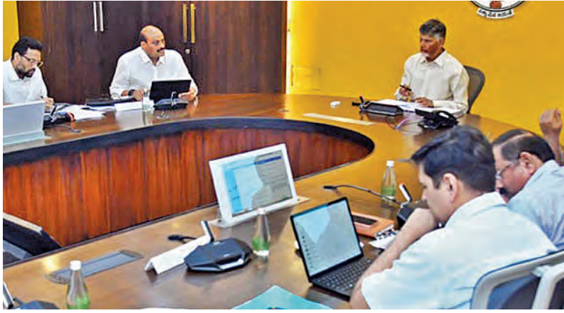
బుధవారం సచివాలయంలో జరిగిన 17వ ఎన్ఐపిబి సమావేశంలో సిఎం చంద్రబాబు

విజయవాడ, మే 6: ప్రభాతవార్త ప్రతినిధి: రాష్ట్రంలో పెట్టుబడులకు సంబంధించి వచ్చిన ప్రతి ప్రతిపాదనా ఒప్పందంగా మారాలని ఏపీ చంద్రబాబు అన్నారు. ఆయా పెట్టుబడిదారీ సంస్థలతో కుదుర్చుకున్న ప్రతి ఒప్పందం గ్రౌండ్ కావాలి అన్నారు. అలా ప్రతి ఒప్పందం పెట్టుబడిగా రూపొందితరం చెందాలన్నారు. ముఖ్యంగా మన రాష్ట్రానికి మరో భారీ పెట్టుబడి వస్తోందన్నారు. విశాఖలో రిలయన్స్ సంస్థ 1,08,010 కోట్లతో డేటా సెంటర్ ఏర్పాటుకు ముందుకు వచ్చిందన్నారు. రాష్ట్రస్థాయి పెట్టుబడుల ప్రోత్సాహక బోర్డు సమావేశం సీఎం చంద్రబాబు అధ్యక్షతన