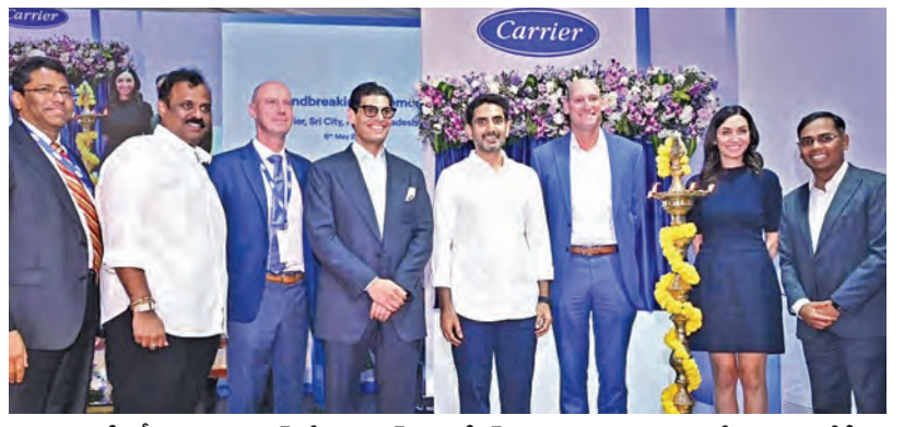
బుధవారం శ్రీసీటీ పారిశ్రామిక పార్క్ లో క్యారియర్స్ లిఫ్ట్ జెనరేటర్ యూనిట్ కు శంకుస్థాపన చేసిన మంత్రి లోకేశ్