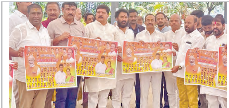
గోడ వత్తికను అవివేకాన్ని ఎవరి కంట