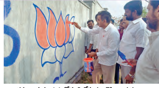
కమలం పుష్ప గురు గోడలపై వేస్తున్న బిజినీ నాయకులు