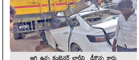
ఆగి ఉన్న కంటైనర్ లారీని డిశ్చార్జ్ కారు