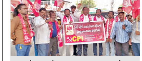
అన్నోజిగూడలో నిరసన తెలుపుతున్న సిపిఐ నేతలు