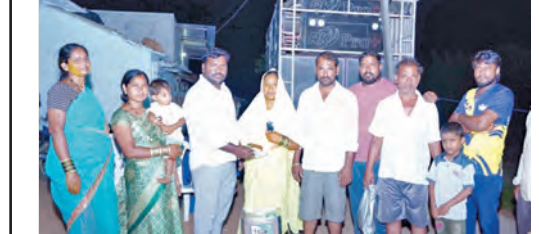
పెళ్లికి ఆర్థిక సాయం అందజేస్తున్న సర్పంచ్

నందిగూడ, మే 6, ప్రభాతవార్త: నందిగూడ మండలం 44 వ జైలు జాతీయ రహదారిపై జరిగిన రోడ్డు ప్రమాదంలో ఒక రు మృతి చెందారు. వివరాలలోకి వెళితే.. నయూరా ప్రెగ్లర్ బండ్ సమయంలో ఆగి ఉన్న కంటైనర్ లారీని హైదరాబాద్ నుండి మహబూబ్ నగర్ వైపు కారు డ్రీ కొట్టింది. ఈ సంఘటనలో కారు డ్రైవర్ అక్కడికక్కడే మృతి చెందారు.