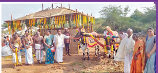
ఆలయ నిర్మాణానికి నాగితోడుని భూమిపూజ చేసిన అర్చకులు, పుర చైర్మన్

వైభవంగా నిర్వహించారు. అలాగే ఆలయ ప్రాంగణంలో ఎద్దులతో కలిసి నాగలి దున్నటం, విత్తనాలు వేయడం తదితర కార్యక్రమాలు నిర్వహించారు. ఈ కార్యక్రమంలో ఆలయ ధర్మకర్తలు, పురజనులు, భక్తులు పాల్గొన్నారు.