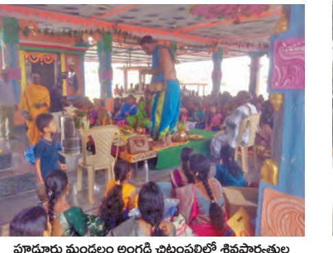
పూడూరు మండలం అంగడి చిట్టంపల్లిలో శివపూజకుల కళ్యాణం జరుగుతున్న దృశ్యం