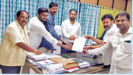
కుత్బుల్లాపూర్ జోనల్ కమిషనర్(ఐఎస్ఎం)కు వినతిపత్రం సమర్పిస్తున్న కైసర్ నగర్ డబుల్ బెడ్రూమ్ వాసులు