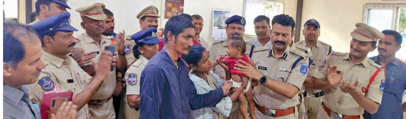
పాపను తల్లిదండ్రులకు అప్పజెప్పిన పోలీసులు