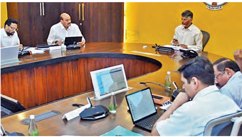
బుధవారం సచివాలయంలో జరిగిన 17వ ఎన్ఎఫ్ఐ సమావేశంలో సిఎం చంద్రబాబు

విజయవాడ, మే 6 ప్రభాతవార్త ప్రతినిధి: రాష్ట్రంలో పెట్టుబడులకు సంబంధించి వచ్చిన ప్రతి ప్రతిపాదనా ఒప్పందంగా మారాలని ఏపీ చంద్రబాబు అన్నారు. ఆయా పెట్టుబడిదారీ సంస్థలతో కుదుర్చుకున్న ప్రతి ఒప్పందం క్రౌండ్ కావాలి అన్నారు. అలా ప్రతి ఒప్పందం పెట్టుబడిగా రూపొందించాలి చెప్పారు. ముఖ్యంగా మన రాష్ట్రానికి మరో భారీ పెట్టుబడి వస్తోందన్నారు. విశాఖలో రిలయన్స్ సంస్థ రూ. 1,08,010 కోట్లతో డేటా సెంటర్ ఏర్పాటుకు ముందుకు వచ్చిందన్నారు. రాష్ట్రస్థాయి పెట్టుబడుల ప్రోత్సాహక బోర్డు సమావేశం సీఎం చంద్రబాబు అధ్యక్షతన