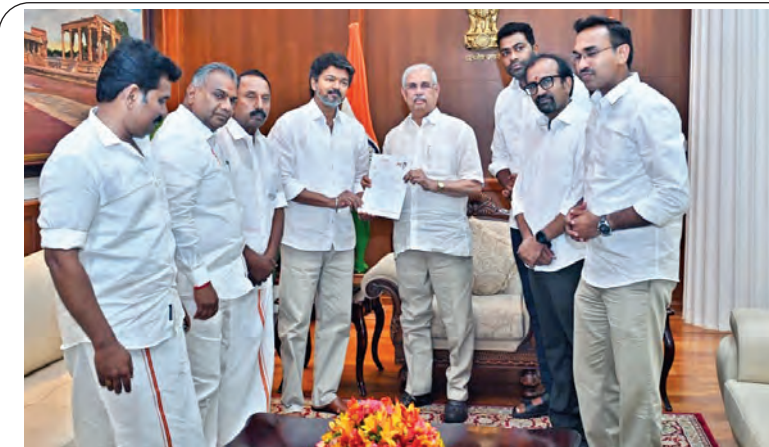
బుధవారం చెన్నైలో తమిళనాడు గవర్నరు కరిసిన డి.వి.ఎ.లతో విజయ్

కూడదని ముఖ్యమంత్రి పేర్కొన్నారు. ప్రస్తుత పోటీ ప్రపంచంలో పెట్టుబడులను ఆకర్షించాలంటే ఇతరుల కంటే మనం ఎలా భిన్నమో ఏపీలో అనుమతులు ఎంత సులభతరమన్నది చాలా చెప్పాలని ఆయన నొప్పించారు. ఏపీలో ప్రాజెక్టులు రాబాలన్న తనకు ఉన్న అధికారులను అనుమతులు ఇచ్చే స్థానాల్లో నియమించాలని సూచించారు. వన్ ఫ్యామిలీ వన్ ఎంటర్ప్రైజీస్లో ఎంఎస్ఎంఇలు కీలకం ఎన్ఎఫ్ఐ సమావేశంలో ముఖ్యమంత్రి తన ప్రసంగాన్ని కొనసాగిస్తూ పెట్టుబడుల విషయంలో భారీ పరిశ్రమలకు ఎంత ప్రోత్సాహం ఇస్తామో... ఎంఎస్ఎంఇలకు అంత >>2