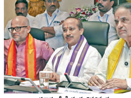
బుధవారం మీడియాకు వివరిస్తున్న చైర్మన్, ఇ.ఎ. అదనపు ఇ.ఎ.