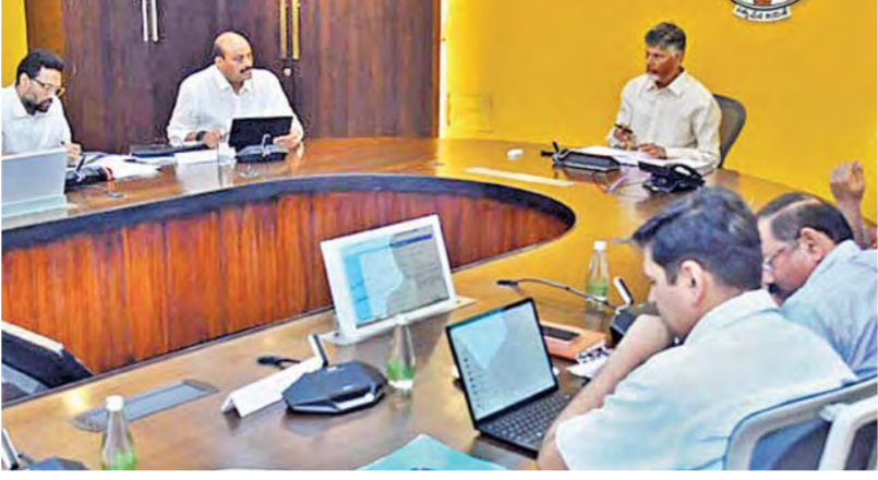
బుధవారం సచివాలయంలో జరిగిన 17వ ఎస్ఐపిబి సమావేశంలో సిఎం చంద్రబాబు

విజయవాడ, మే 6 ప్రభాతవార్త ప్రతినిధి: రాష్ట్రంలో పెట్టుబడులకు సంబంధించి వచ్చిన ప్రతి ప్రతిపాదనా ఒప్పందంగా మారాలని ఏపీ చంద్రబాబు అన్నారు. ఆయా పెట్టుబడిదారీ సంస్థలతో కుదుర్చుకున్న ప్రతి ఒప్పందం గ్రాండ్ కావాలి అన్నారు. అలా ప్రతి ఒప్పందం పెట్టుబడిగా రూపొందించాలని చెప్పారు. ముఖ్యంగా మన రాష్ట్రానికి మరో థాన్ పెట్టుబడి వస్తోందన్నారు. విశాఖలో రిలయన్స్ సెన్సార్ రూ.1.08,010 కోట్లతో డేటా సెంటర్ ఏర్పాటుకు ముందుకు వచ్చిందన్నారు. రాష్ట్రస్థాయి పెట్టుబడుల ప్రోత్సాహక బోర్డు సమావేశం సీఎం చంద్రబాబు అధ్యక్షతన