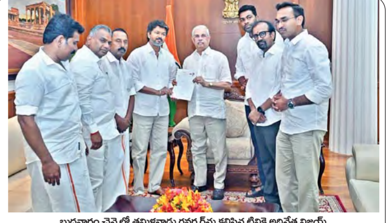
బుధవారం చెన్నైలో తమిళనాడు గవర్నరు కనకలక్ష్మి అధినేత విజయ్

జరిగింది. సచివాలయంలో జరిగిన ఈ 17వ ఎస్ఐపిబి సమావేశంలో 25 ప్రాజెక్టులకు చెందిన రూ.2,01,023 కోట్ల పెట్టుబడులకు ఆమోదం తెలిపారు. ఈ ప్రాజెక్టుల ద్వారా 39,067 మందికి ఉద్యోగ అవకాశాలు లభించనున్నాయి. సత్యసాయి జిల్లాలో రూ.51 వేల కోట్లతో సోలార్ పవర్ ప్లాంట్స్, బ్యాటరీ ఎనర్జీ స్టోరేజీ సిస్టమ్ల కూడా రిలయన్స్ సంస్థ ఏర్పాటు చేయనుందన్నారు. జి కడపలో రూ.12 వేల కోట్లతో అలాస్ హైడ్ ఎనర్జీ పవర్ స్టోరేజీ ప్రాజెక్టును, తిరుపతిలో రూ.2,500 కోట్లతో రాయల్ ఎన్ఫీల్డ్ బోర్డు సమావేశం సీఎం చంద్రబాబు అధ్యక్షతన జరిగింది. సచివాలయంలో జరిగిన ఈ 17వ ఎస్ఐపిబి సమావేశంలో 25 ప్రాజెక్టులకు ఆమోదం తెలిపింది. ఒక పెట్టుబడి, పరిశ్రమ రాష్ట్రానికి వచ్చే విషయంలో అనుమతులు సులభ శంకుస్థాపన, ప్రారంభోత్సవం వరకు నిర్దిష్ట మంత్రి నాధా చంద్రబాబు నాయుడు అన్నారు. ఒప్పందం చేసుకున్న కంపెనీల శంకుస్థాపన సులభ జరగజేయాలని సీఎం చంద్రబాబు అన్నారు. ప్రభుత్వపరంగా ఇవాల్సిన అనుమతుల విషయంలో ఒక్క రోజుకూడా జాప్యం జరగ