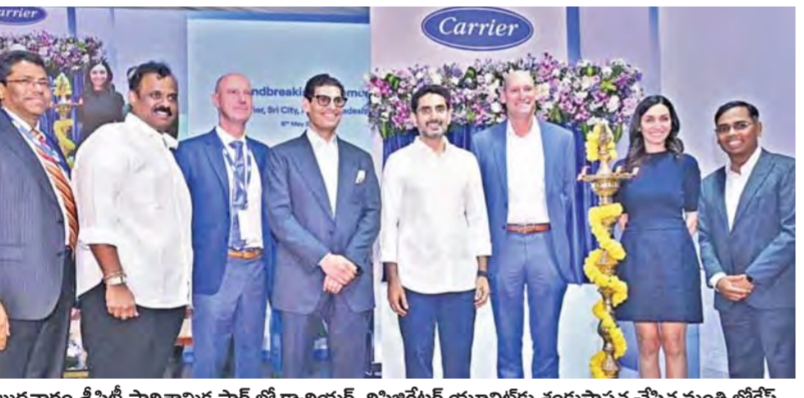
బుధవారం శ్రీనివాస పాలకొండ పార్క్ లో క్యారియర్స్ లిఫ్టిజేషన్ యూనిట్ కు శంకుస్థాపన చేసిన మంత్రి లోకేశ్