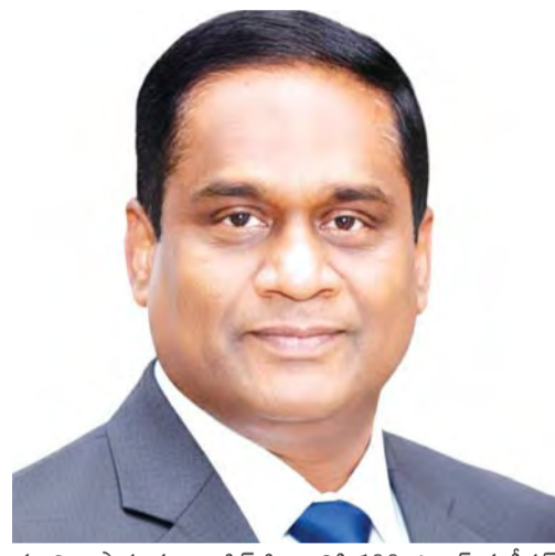
యాన్ని స్టాఫ్.. ప్రాజెక్ట్ సిబ్బందికి 100 ఎయిర్ కండిషన్డ్ హెల్త్ కేర్ పంపిణీ.. హార్ట్ ప్రాంతంలో భద్రత రెండు కోసం రెండు డ్రోన్ సర్వైలెన్స్ వ్యవస్థలను ఏర్పాటు.. క్లీన్ మేరీన్ ప్రవెంటివ్ హెల్త్ మరియు సేఫ్ డ్రింకింగ్ వాటర్ పీఎం గవర్నమెంట్ గవర్నర్ సర్కార్ విద్యార్థులకు హెచ్పీ

విశాఖపట్నం పోర్ట్ అథారిటీ సిగల్ మర్త కలికితరాయి చేరింది. ప్రతిష్ఠాత్మకమైన గ్రీన్ బెక్ సీఎస్ఆర్ అవార్డ్స్ 2026లో పోర్ట్ రెండు విభాగాల్లో గోల్డ్ అవార్డులు గెలుచుకుంది. ఆంధ్ర ప్రదేశ్ రాష్ట్రంలో హెల్త్ కేర్ ప్రమోషన్ మరియు సిగల్ డెవలప్ మెంట్ విభాగాల్లో వరుసగా రెండో ఏడాది విశాఖపట్నం పోర్ట్ ఈ ఘనతని సాధించడం విశేషం. విజేతల ఎంపిక కోసం ఏర్పాటు చేసిన న్యాయనిర్ణేతల మండలి ముందు పోర్ట్ నిర్వహించిన వర్చువల్ డ్రెజింగ్ మరియు ప్రశ్నోత్తరాల్లో ఉద్భవించిన ప్రతిభ అధారంగా విజేతలను ఎంపిక చేశారు. ప్రతి సంవత్సరం ప్రధానం చేసే గ్రీన్ బెక్ సీఎస్ఆర్ అవార్డులు, కార్పొరేట్ సామాజిక బాధ్యత లో భాగంగా అత్యుత్తమ సేవలు అందించిన సంస్థలను గుర్తించి సత్కరిస్తాయి. హెల్త్ కేర్ మరియు సిగల్ డెవలప్ మెంట్ రంగాల్లో పోర్ట్ చేపట్టిన వినూత్న కార్యక్రమాలకు ఈ అవార్డులు లభించాయి. హెల్త్ కేర్ ప్రమోషన్ కార్యక్రమాలపై విభాగంలో పోర్ట్ వలస సేవా కార్యక్రమాలు చేపట్టింది.. అనాథ ఆస్పత్రుల పాఠశాల విద్యార్థులకు మధ్యాహ్న భోజన పథకం నిర్వహించి.. వివిధ ప్రాంతాల్లో మూడు నీటి కుడి యంత్రాలను ఏర్పాటు.. "ఆరోగ్యం" ప్రవెంటివ్ హెల్త్ మరియు సేఫ్ డ్రింకింగ్ వాటర్ పీఎం