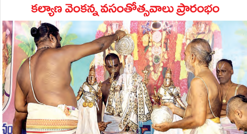
వందగిరి, మే 7 ప్రభాతవార్త: