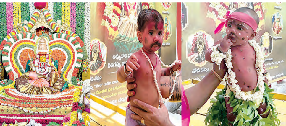
తిరుపతి, మే 7 ప్రభాతవార్త:

తిరుపతి గ్రామదేవతగా పూజలందుకుంటున్న తాతయ్యగుంట గంగమ్మ జాతక వేడుకల్లో గురువారం ఉదయం బండవేషంలో అమ్మవారు దర్శనమిచ్చారు. ఆలయం పరిసరాల్లో పట్టిపల్లి ఏర్పాటుతో జాతరవేడుకలు సాగుతున్నాయి. గురువారం ఉదయం అమ్మవారిని దర్శించారు. పెద్దలు మొక్కుబడుల్లో శరణుంఠా ఎర్రటి కంకుమ పొడి రాసుకుని బొగ్గుపొడి తెల్లని చుక్కలు