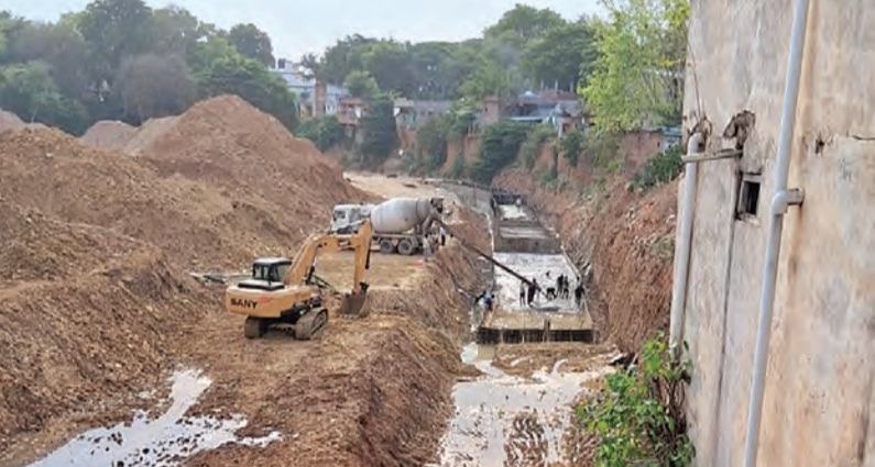
రైల్వేకోడూరు రూరల్, మే 7 ప్రభాతవార్త