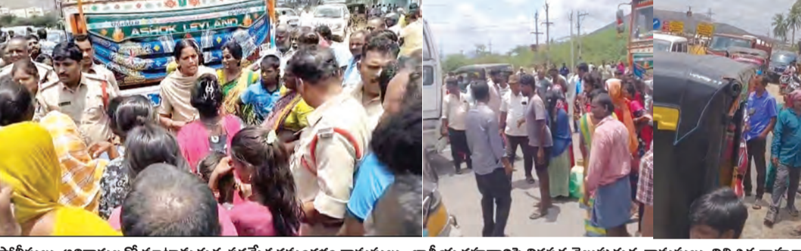
వోలీసులు, అధికారులతో మాట్లాడుతున్న పరమేశ్వరమంగళం గ్రామస్థులు, జాతీయ రహదారిపై నిరసన తెలుపుతున్న గ్రామస్థులు, నిలిచిన వాహనాలు

పుత్తూరు రూరల్, మే 7 ప్రభాతవార్త: పుత్తూరు మండల పరిధిలోని పరమేశ్వర మంగళంలో తాగునీటి సమస్య తీవ్ర రూపం దాల్చడంతో గ్రామస్థులు గురువారం జాతీయ రహదారిపై ధర్మా