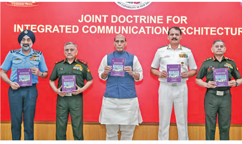
శుభ్రతల రక్షణ మంత్రి రాజీవ్ సింగ్ జైపూర్ లో జరిగిన సంయుక్త కమాండర్ల సదస్సు హాజరైన దృశ్యం