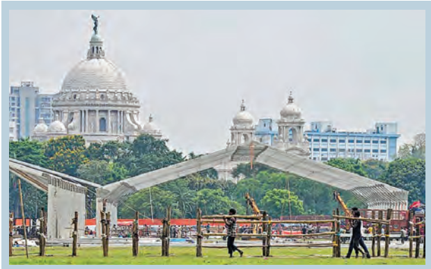
కోకతాళిని బ్రిగేడ్ పేరేడ్ గ్రౌండ్స్ లో సువేందు అభివృద్ధి ప్రమాణ స్వీకారానికి ముస్తాబుతున్న వేదిక