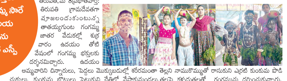
తిరుపతి గ్రామదేవతగా పూజలందుకుంటున్న తాతయ్యగుంట గంగమ్మ జాతర వేడుకల్లో శుక్రవారం ఉదయం తోటి వేషంలో గంగమ్మ భక్తులకు దర్శనమిచ్చారు. ఉదయం