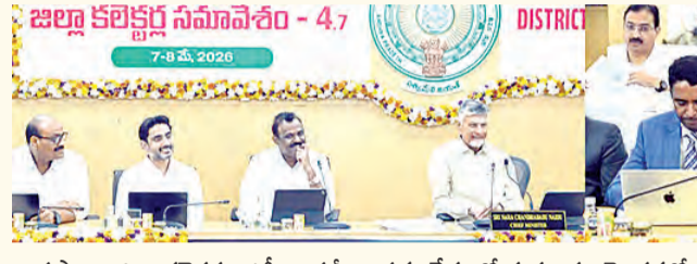
రాష్ట్రస్థాయి జిల్లా కలెక్టర్లు, ఎస్పీల సమీక్షా సమావేశంలో శుక్రవారం రెండవరోజు తిరుపతి జిల్లా కలెక్టర్, జిల్లా ఎస్పీ, చిత్తూరు జిల్లా కలెక్టర్, ఎస్పీలు

ప్రజలతో మమేకం కావాలని జిల్లా కలెక్టర్లకు సిఎం నిర్దేశం