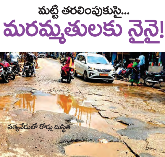
సత్యవేదంలో రోడ్డు దుస్థితి