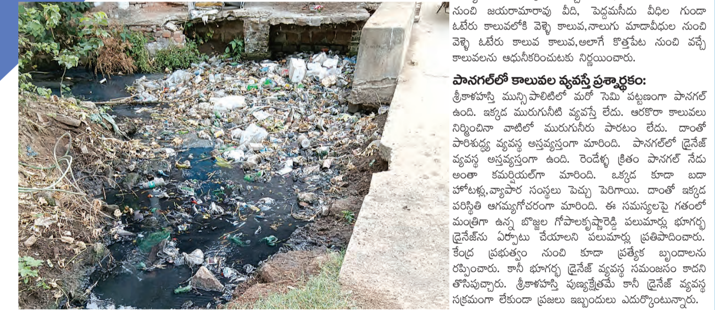
శ్రీకాళహస్తిలో పెరుగుతోయిన కాలువ

శ్రీకాళహస్తి, మే 8 ప్రభాతవార్త: శ్రీకాళహస్తి వీధుల్లో ఎటు మూసినా 'లాడ్జీలు' వచ్చాయి. అవగంజంతో స్థలం లభించినా అక్కడ మున్నిపాలిలోని పురాతన కాలం నాటి మురుగునీటి లాడ్జీలు నిర్మిస్తున్నారు. ఇకపట్టణంలోని ప్రధాన కాలువలైన మంజినీళ్లు గుంట నుంచి అయ్యలనాడు చెరువులోకి వచ్చే కాలువ, అలాగే వెలం పాశం నుంచి జయరామాచారి వీధి, పెద్దపేట వీధిల గుండా ఓటీరు కాలువలోకి వెళ్ళే కాలువ, నాలుగు మూడవీధుల నుంచి వెళ్ళే ఓటీరు కాలువ కాలువ, అలాగే కొత్తపేట నుంచి వచ్చే కాలువలను ఆధునికీకరించుటకు నిర్ణయించారు.