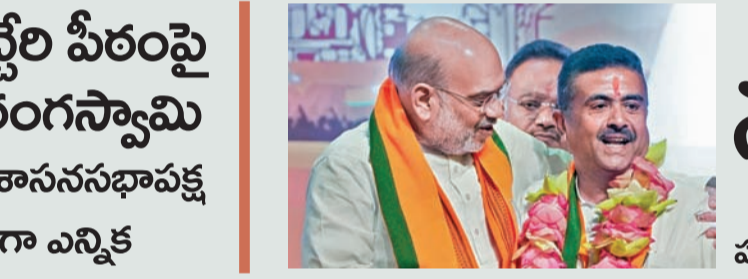
బెంగాల్ సిఎంగా సువేంద్రు నేడు కోల్ కతాలో ప్రమాణం హాజరు కానున్న ప్రధాని, కేంద్రమంత్రులు

కోల్ కతా, మే 8: అన్ని ఉపగ్రామాలకు తెరచివేస్తూ, పశ్చిమ బెంగాల్ ముఖ్యమంత్రి అభ్యర్థిగా సువేంద్రు అధికారిని భారతీయ జనతా పార్టీ ఎంపిక చేసింది. శుక్రవారం కోల్ కతాలో కేంద్ర హోం మంత్రి అమిత్ షా అధ్యక్షతన టిజిపి శాసనసభా పక్ష సమావేశం జరిగింది. ఈ సమావేశంలో సువేంద్రు పేరు ప్రతిపాదనకు రాగా, కొత్తగా ఎంపికైన ఎమ్మెల్యేలు ఏకగ్రీవంగా ఆమోదించారు. దీంతో పశ్చిమబెంగాల్ టిజిపి శాసనసభాపక్ష నేతగా సువేంద్రు అధికారిని కేంద్రం హోం మంత్రి అమిత్ షా ప్రకటించారు. కాబట్టి సిఎంగా సువేంద్రును అభివృద్ధింపారు. సోనార్ బంగ్లా కలం నాశారానికి కొత్త ప్రభుత్వం పనిచేస్తుందని చెప్పారు. తృణమూల కాంగ్రెస్, లెఫ్ట్ పార్టీలను ఓడిస్తూ తీర్చిదిద్దిన ప్రజలకు కృతజ్ఞతలు తెలిపారు. బెంగాల్ ఎన్నికల్లో పలు ఔదారీలు,