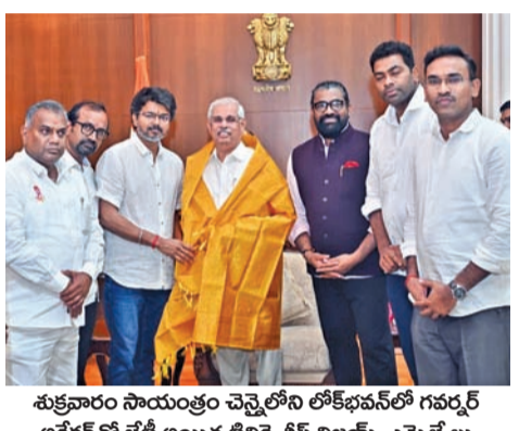
శుక్రవారం సాయంత్రం చెన్నైలోని లోక్ సభలో గవర్నర్ అధ్యక్షతన భేటీ అయిన టిపికె చీఫ్ విజయ్, ఎమ్మెల్యేలు

చెన్నై, మే 8: తమిళనాడు రాజకీయాలు గంటగంటకు మారిపోతున్నాయి. విజయ్ మద్దతిస్తామని ప్రకటించిన చిన్నపాళ్ళిలు ఇప్పుడు ముఖం చాటేస్తున్నాయి. మూడు పర్యాయాలు గవర్నర్ ను కలిసిన విజయ్ తనకు మెజారిటీ ఉందని లేఖలు ఇచ్చినప్పటికీ గవర్నర్ సంతృప్తి ప్రకటించలేదు. మరో ఇద్దరు తక్కువగా ఉన్నారని, 118 మార్కు వచ్చిన తర్వాత మాత్రమే ప్రభుత్వం ఏర్పాటుకు ఆహ్వానిస్తామని లోక్ సభలో కార్యక్రమం సుస్పంధించడంతో విజయ్ ప్రమాణస్వీకారం శనివారం దాదాపుగా లేనట్లైంది. ముందుగా సిపిఐ, సిపిఎం పార్టీలు మద్దతిస్తామని ప్రకటించాయి. విజయ్ నేరుగా ఆ పార్టీల కార్యాలయాలకు వెళ్లి వారిని కలిసారు. తాము బయటపడినవి మద్దతిస్తామని మతశక్తులు రంగప్రవేశం చేయనియందుకా ఉండేందుకే టిపికెకు మద్దతిస్తామని ఈ రెండుపార్టీలు ప్రకటించాయి. అయితే తాము డిఎంకే కూటమిలోనే ఉంటామని చెప్పిన వామపక్షాలు టిపికెకు బయటపడినవి మద్దతిస్తామని సుస్పంధించాయి. అలాగే మరో రెండుపార్టీలున్న విసికె కూడా మద్దతిస్తున్నట్లు ముందు ప్రకటించి తర్వాత ముఖం చాటేసింది. అదేవిధంగా రెండుపార్టీలు గెలిచిన ఐయుఎంఎల్ కూడా తాము టిపికెకు మద్దతివ్వడం లేదని ప్రకటించడంతో తమిళనాడు రాజకీయ స్వరూపం ఒక్కసారిగా మారిపోయింది. విసికె, ఐయుఎంఎల్ పార్టీలు తమ