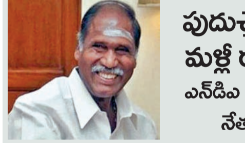
పుదుచ్చేరి పీఠంపై మళ్లీ రంగస్థాయి ఎన్ డిఎ శాసనసభాపక్ష నేతగా ఎన్నిక

తలమానికంగా లగచర్ల పాలిత్రామికవాడ : బహిరంగసభలో సిఎం రేవంత్ రెడ్డి విధానాల్లో జిల్లా ప్రతినిధి, మే 8, ప్రభావవంత : అభివృద్ధిలో దేశంలోనే కొడంగల్ అగ్రగామిగా నిలుస్తోందని ముఖ్యమంత్రి రేవంత్ రెడ్డి అన్నారు. ప్రస్తుతం శంకుస్థాపన చేసిన పనులను 2027 డిసెంబరు నాటికల్లా పూర్తి చేస్తామని సుస్పంధించారు. తిరుమల తిరుపతి దేవస్థానం మాదిరిగా కొడంగల్ శ్రీ వేంకటేశ్వర స్వామివారి ఆలయాన్ని రూ.110 కోట్లతో పునర్ నిర్మిస్తామని చెప్పారు. శుక్రవారం పలు అభివృద్ధి పనులకు శంకుస్థాపన చేసిన అనంతరం బహిరంగసభలో సిఎం రేవంత్ రెడ్డి మాట్లాడారు. ఒక్కొక్క ఒక్క విద్యుత్ సబ్స్టేషన్ మంజూరు కోసం నానా తంటాలు వడ్డామని ఆయన గుర్తు చేశారు. ప్రస్తుతం సరిపడా కొత్త సబ్స్టేషన్లు మంజూరు చేసే అధికారం తమకు ఉందని సుస్పంధించారు. కొడంగల్ ప్రజల ఆశీర్వాదంతోనే ముఖ్యమంత్రి వదలి వరకు ఎదిగానని తెలిపారు. పేదల తిరుపతిగా పేరుగాంచిన కొడంగల్ వేంకటేశ్వరస్వామి ఆలయంలో పాటు కోట్లలో