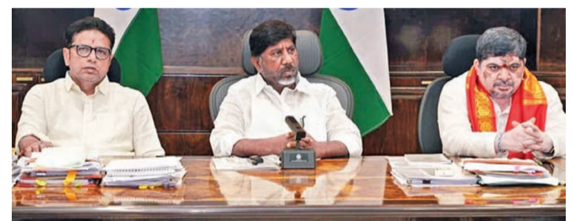
శుక్రవారం ప్రజాభివృద్ధిలో జరిగిన మూసీ పునరుజ్జీవ ప్రాజెక్టు కేబినెట్ సమావేశంలో డి.సిఎం భక్తి, మంత్రులు మొదలై ప్రధాని, పాపం ప్రభాకర్

5 దశల్లో 55 కి.మీ మేర అభివృద్ధి పనులు కేబినెట్ సబ్ కమిటీ సమావేశంలో డిసెంబర్ 31 వరకు పూర్తి చేయాలి