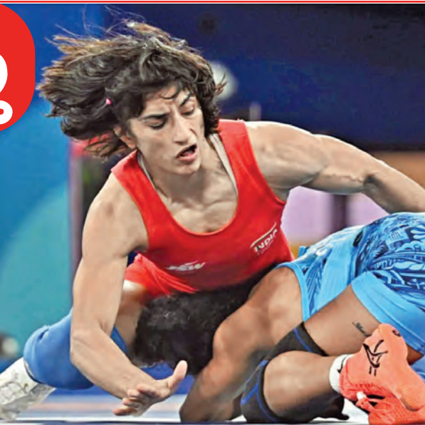
భూపతిపై లైంగిక వేధింపుల ఆరోపణలపై మహిళా రెజ్లింగ్ కు మద్దతుగా వినేష్ ఫోగట్ నిలిచింది.

ఉల్లంఘించారని ఆరోపించింది. మహిళా రెజ్లింగ్ కు ఆదరణ తెచ్చిన వినేష్ ఫోగట్... రెండుసార్లు ప్రపంచ ఛాంపియన్ షిప్ మెడలిస్ట్. ఆసియా క్రీడల్లో స్వర్ణం, సిల్వర్ మెడల్స్... కామన్వెల్త్ క్రీడల్లో మూడు స్వర్ణాలు, ఏషియన్ ఛాంపియన్ షిప్ లో మెడల్స్ తో మెరిశారు. 2024 పారిస్ ఒలింపిక్స్ లో ఎకంగా ఫైనల్ చేరింది. అయితే ఫైనల్ కు ముందు నిర్వహించిన వెయిట్ లో వంద గ్రాములు ఎక్కువగా ఉందని వినేష్ ఫోగట్ పై అనర్హత వేటు పడింది. దీన్ని ఛాలెంజ్ చేసిన ఫోగట్... అదే ఏడాది అగస్టులో రెజ్లింగ్ కు గుడ్ బై చెప్పింది. రాజకీయాల్లోకి ఎంజీ ఇబ్బి 2024లో హర్యానాలోని జలానా నియో జక్ వద్ద నుంచి ఎమ్మెల్యేగా గెలుపొందారు. 2023లో డబ్ల్యుఎఫ్ఐ అప్పటి అధ్యక్షుడు ట్రైబ్యూనల్ ఫోగట్ నిలిపింది.