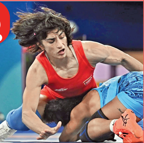
భూషణ్ పై లైటింగ్ వేదింపుల ఆరోపణలపై మహిళా రెజ్లింగ్ కు మద్దతుగా వినేష్ ఫోగట్ నిలిచింది.

ఉల్లంఘించారని ఆరోపించింది. మహిళా రెజ్లింగ్ కు ఆదరణ తెచ్చిన వినేష్ ఫోగట్... రెండున్నర ప్రపంచ ఛాంపియన్ షిప్ మెడలిస్ట్. ఆసియా క్రీడల్లో స్వర్ణం, సెల్యూర్ మెడల్స్... కామన్వెల్త్ క్రీడల్లో మూడు స్వర్ణాలు, ఏషియన్ ఛాంపియన్ షిప్ లో మెడలిస్ట్ మెరిశారు. 2024 పారిస్ ఒలింపిక్స్ లో ఎకంగా ఫైనల్ చేరింది. అయితే ఫైనల్ కు ముందు నిర్వహించిన వెయిట్ లో పంద గ్రాములు ఎక్కువగా ఉందని వినేష్ ఫోగట్ పై అనర్హత వేటు పడింది. దీన్ని ఛాలెంజ్ చేసిన ఫోగట్... అదే ఏడాది అగస్టులో రెజ్లింగ్ కు గుడ్ బై చెప్పింది. రాజకీయాల్లోకి ఎంట్రి ఇచ్చి 2024లో హర్యానాలోని బాలానా నియో ఇన్స్టిట్యూట్ నుంచి ఎమ్మెల్యేగా గెలుపొందారు. 2023లో డబ్ల్యూఎఫ్ఎ అప్పటి అధ్యక్షుడు బ్రిజ్