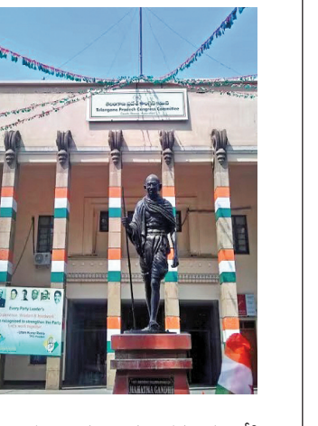
ఎవరిని ఉపసంహరించాలో కొత్తగా ఎవరిని మంత్రమండలిలోకి తీసుకోవాలో అనే అంశంపై అధిష్టానంకు ఒక స్పష్టత ఉన్నప్పటికీ ఢిల్లీకి పిలిపే ఆ సీనియర్ అభిప్రాయం కూడా తీసుకొని పార్టీ ప్రభుత్వ బలోపేతంకు పావులు కదపబోతున్నట్లు తెలిసింది. ముఖ్యంగా కాంగ్రెస్ పార్టీకి ప్రభుత్వం >>2

హైదరాబాద్, మే 9: ప్రణాళికాబద్ధ: కాంగ్రెస్ అధిష్టానం తెలంగాణ ప్రభుత్వం, కాంగ్రెస్ పార్టీలో సంస్థాగత మార్పులు తీసుకోవల్సి ఉన్న ప్రభుత్వంను అటు పార్టీని గాడిన పెట్టేందుకు దృష్టిసారించినట్లు తెలిసింది. అఖిలభారత కాంగ్రెస్ కమిటీ తెలంగాణ ఇంచార్జ్ మీనాక్షి నటరాజన్ అధినాయకత్వం కింది సమావారం ఆధారంగా ప్రభుత్వంలో ఇంకా పట్టుసాధించలేని మంత్రులను, వివాదాలతో ప్రజల నుంచి ఆసంతృప్తి ఎదురవుతున్న మంత్రులను తొలగించడంతోపాటు, మంత్రి మండలిలో సమర్థులకు కొత్తగా అవకాశాలు ఇచ్చేందుకు అధిష్టానం కనరత్న ప్రాంతాధిపత్య విశ్వసనీయంగా తెలిసింది. తెలంగాణ అవినీతి దిశాల్పనలో గానై, అతరువాత ముఖ్యమంత్రి రేవంత్ రెడ్డి, దుద్దిక శ్రీధర్ బాబుతో టీపీసీసీ టీవీ మహాపేతుమార్ గోడ పాటు ఇతర సీనియర్ మంత్రులు ఒకరిద్దరినీ ఢిల్లీకి పిలిపించి పార్టీలో ప్రభుత్వంలో చేపట్టే మార్పులను వివరించి దానికి అనుగుణంగా క్షేత్రస్థాయిలో అనుసరించాల్సిన కార్యాచరణ కూడా వారికి అందించే >>2