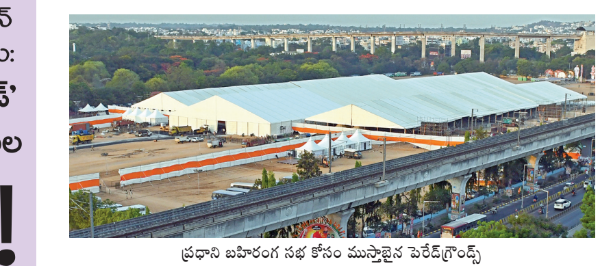
ప్రధాని బహిరంగ సభ కోసం ముస్తాబైన పెరేడ్ గ్రౌండ్స్