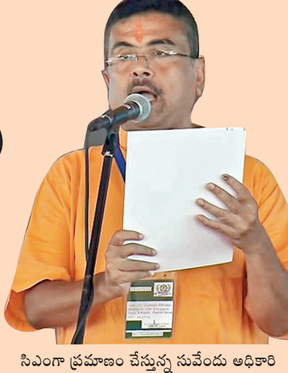
సిఎంగా ప్రమాణం చేస్తున్న సువేందు అధికారి

కోల్కతా, మే 9: పశ్చిమ బెంగాల్ ముఖ్యమంత్రిగా సువేందు అధికారి ప్రమాణ స్వీకారం చేశారు. కోల్కతాలోని చారిత్రాత్మక 'బ్రిగేడ్ వరేడ్ గ్రౌండ్'లో శనివారం నిర్వహించిన ప్రత్యేక కార్యక్రమంలో సువేందు అధికారి ముఖ్యమంత్రిగా ప్రమాణం చేశారు. బెంగాల్ గవర్నర్ ఆర్.ఎన్.రవి ఆయనతో ప్రమాణం చేయించారు. కార్యక్రమానికి >>2