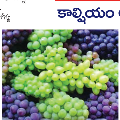
1. 30 దాటాక కొందరు మహిళల్లో ఎముక బలం తగ్గుతుంది. గ్రాఫ్ను తరచూ తీసుకోండి. దీనిలో కొన్నింటిని పాటించడం మెగ్గినియం వంటి ఖనిజాలు పువ్వులుగా ఉండి, ఎముకలను దృఢంగా చేయడంలో సాయపడతాయి. పాలిఫినాల్ రక్తంలోని చెడుకొవ్వులను

సీజన్లో సంబంధం లేకుండా డోలకే పండ్లలో డ్రాక్ ఒకటి! పండ్లనా, ఎండినపండ్లనా ఇది మనకు అందించే పోషకాహారం! శారీరకంగానే కాదు.. మానసికంగానూ ఆరోగ్య ప్రయోజనాలు అందించే దీని గురించి తెలుసుకుందాం..