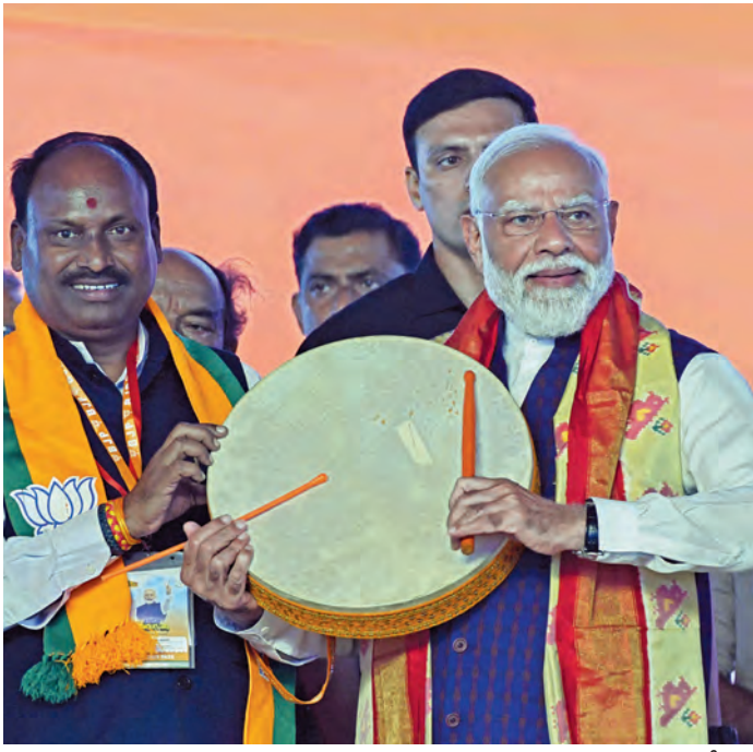
ఆదివారం హైదరాబాద్ లో జరిగిన బహిరంగ సభలో దమ్మ వాయిచిన ప్రధాని మోడీ