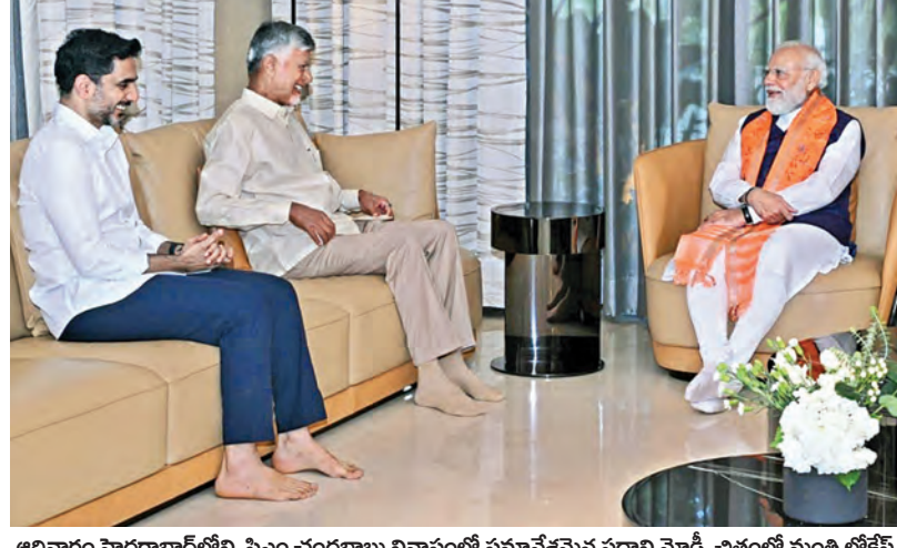
ఆదివారం హైదరాబాద్ లోని సీఎం చంద్రబాబు నివాసంలో సమావేశమైన ప్రధాని మోడీ, చిత్తూరు మంత్రి లోకేశ్

ప్రధాని, చంద్రబాబు నాకు గురువులు: మంత్రి లోకేశ్ ఎపి అభివృద్ధికి ప్రధాని చేసిన సాయానికి కృతజ్ఞులు చెప్పిన సీఎం చంద్రబాబు ఇక బరువు తగ్గొద్దంటూ లోకేశ్ కు ప్రధాని సలహా గంటపైగా చంద్రబాబు నివాసంలో గడిపిన ప్రధాని మోడీ