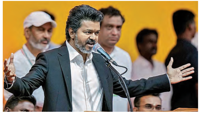
ఆదివారం చెన్నైలోని నెహ్రూ స్టేడియంలో సీఎంగా ప్రమాణం చేస్తున్న విజయ్ దళపతి విజయ్

ప్రభాతవార్త ప్రధాన ప్రతినిధి, హైదరాబాద్, మే10: పశ్చిమ బంగాల్ లో తొలిసారి బీజేపీ ప్రభుత్వం ఏర్పడిందని ప్రధాని నరేంద్ర మోడీ అన్నారు. పశ్చిమబంగాల్ లో బీజేపీ చరిత్రాత్మక విజయం సాధించిందని గుర్తు చేశారు. అక్కడి ప్రజలు చేసిన ప్రతిభ ప్రకారం బీజేపీని గెలిపించుకున్నారని కొనియాడారు. తెలంగాణ ప్రజల నుంచి కూడా అలాంటి ఉత్సాహమే కనిపిస్తోందని చెప్పారు. తెలంగాణలో ఈసారి వచ్చేది బీజేపీ ప్రభుత్వమే అని ధీమా వ్యక్తం చేశారు. ఆదివారం సాయంత్రం పరేడ్ గ్రౌండ్స్ లో బీజేపీ ఏర్పాటు చేసిన భారీ బహిరంగ సభలో ప్రధాని మోడీ ప్రసంగించారు. అంతకుముందు తన కోసం కార్యకర్తలు తెచ్చిన పెయింటింగ్ ను సేకరించాలని