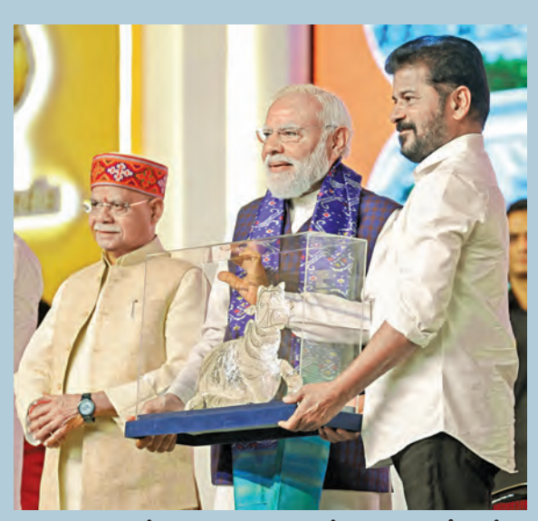
హైదరాబాద్ లో ఆదివారం హెచ్ఎస్సీలో జరిగిన సమావేశంలో ప్రధాని మోడీకి జాబితాను అందజేస్తున్న సీఎం రేవంత్.

మహాబూబ్ నగర్ 11-5-2026 సోమవారం సంపుటి: 32 సంచిక: 100 పేజీలు: 10+4 వెల: 6.50