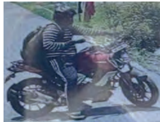
సిన ఫుటేజీలో పారా అవుతున్న గుర్తు తెలియని వ్యక్తి