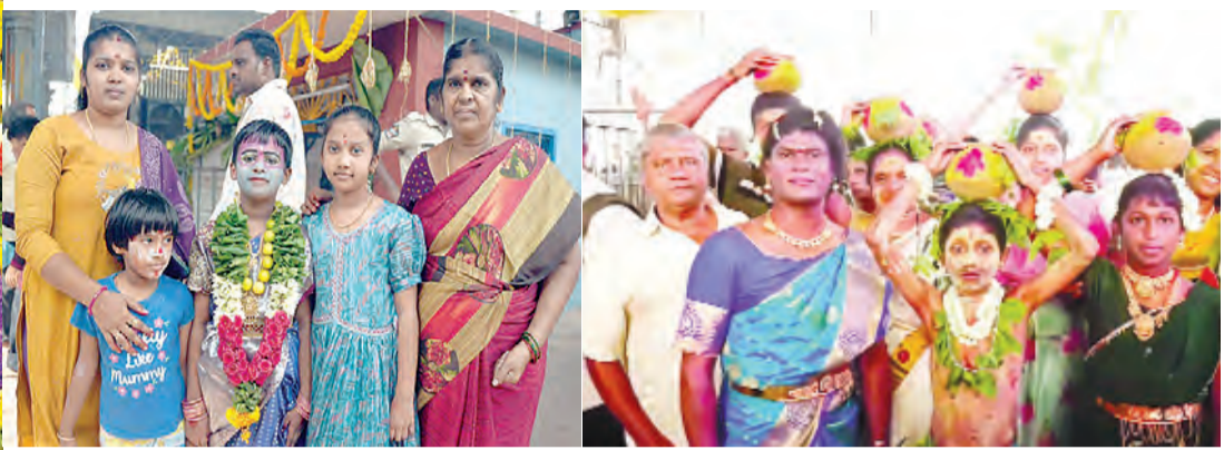
తిరుపతి, మే 10 ప్రభాత వార్త తిరుపతి నగరగ్రామదేవత తాతయ్యగుంట గంగమ్మ ఆలయం జాతరవేడుకల్లో ఆదివారం మాతంగి వేషంతో అమ్మవారు వైభవంగా దర్శనమిచ్చారు. మాతంగి వేషధారణలు భక్తులను విశేషంగా ఆకట్టుకున్నాయి. ఈ జాతరలో భాగంగా పురుషులు స్త్రీల వేషాల్లో, స్త్రీలు పురుషుల వేషాల్లో అలయానికి చేరుకుని

అమ్మవారికి మొక్కులు చెల్లించుకున్నారు. సంప్రదాయబద్ధంగా మాతంగి వేషాలు ధరించిన భక్తులు గంగమ్మ నామస్మరణల మధ్య పొంగి పొలింపై పెట్టి నైవేద్యాలు సమర్పించారు. ఆలయం భక్తులతో కిక్కిరిసిపోగా, జాతర ప్రాంగణం భక్తి ఉత్సాహంతో మారింది.