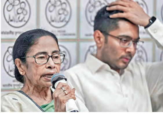
అవినీతి, లాభీయంగ్, వర్గపారాటలతోనే ఓటమి ముఖత, అభివృద్ధిపై నాయకుల విమర్శల దాడి ముగ్గురు నేతలు ఆరోజు పార్టీ సంచలన బహిష్కరణ

కోటేశ్వర, మే 10: పశ్చిమబెంగాల్ అసెంబ్లీ ఎన్నికల్లో తృణమూల కాంగ్రెస్ ఘోర పరాజయం పాలవడంతో ఆ పార్టీలో కుమ్ములాటలు, అంతర్గత కలహాలు వెలుగుచూస్తున్నాయి. ఎమ్మెల్యేలు, ఎంపీలతోపాటు, మాజీ మంత్రులు సైతం పార్టీ అగ్రనేతల తీరును ఛాపాటంగా ఎండగడుతున్నారు. పార్టీ అధినేత్రి మమతా బెనర్జీపై మాజీ నేతల శాఖ సహాయ మంత్రి, క్రికెట్ మనోజ్