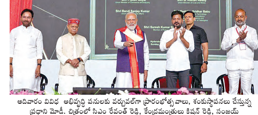
అదివారం వివిధ అభివృద్ధి పనులకు వర్చువల్ గా ప్రారంభోత్సవాలు, శంకుస్థాపనలు చేస్తున్న ప్రధాని మోడీ. చిత్రంలో సిఎం రేవంత్ రెడ్డి, కేంద్రమంత్రులు కిషన్ రెడ్డి, సంజయ్

3,175 కోట్ల రూపాయలు అని సమాచారం. ఆ తర్వాత జూహూబాద్ ఇండస్ట్రియల్ ఏరియా, 2,360 కోట్లతో నిర్మించనున్న ఇంటిగ్రేటెడ్ ఇండస్ట్రియల్ స్టాల్ సిటీకి శంకుస్థాపన చేశారు. 1,243కోట్ల రూపాయలతో వర్చువల్ చేసిన కాజీపేట- విజయవాడ మల్టీ ట్రాకింగ్ మూల్ రైల్వే లైన్ పనుల వర్చువల్ గా ప్రారంభించారు. వంగల్లో పీఎం మిట్ టెక్స్టైల్ పార్కును ప్రారంభించారు. హైదరాబాద్ మల్టీపూర్లో పెట్లలియం టెక్స్టైల్ ను ప్రారంభించారు. హైదరాబాద్ నూతనంగా నిర్మించిన సింధు అనుపత్రిని రిమోట్ ద్వారా ప్రారంభించారు.