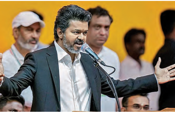
ఆదివారం చెన్నైలోని నెహ్రూ స్టేడియంలో సిఎం ప్రమాణం చేస్తున్న విజయ్

ప్రభాతవార్త ప్రధాన ప్రతినిధి, హైదరాబాద్, మే10: మూడోసారి ప్రధాని ఆయాశ్చ తొలిసారి తెలంగాణ పర్యటనకు వచ్చిన ప్రధాని మోడీ ఆదివారం హైదరాబాద్ లోని హెచ్ఎస్సీలో నుంచి పలు అభివృద్ధి పనుల ప్రారంభోత్సవాలు, శంకుస్థాపనలు వర్చువల్ గా చేశారు. ఈ సందర్భంగా ఆయన మాట్లాడుతూ.. ప్రారంభించిన కొత్త ప్రాజెక్టులు దేశవ్యాప్తంగా వేలాది ఉద్యోగాలను సృష్టించనున్నాయన్నారు. మౌలిక వసతుల కల్పనకు కేంద్ర ప్రభుత్వం అత్యధిక ప్రాధాన్యమిస్తోందని ఆయన స్పష్టం చేశారు. అభివృద్ధి ప్రాజెక్టుల ద్వారా ఆర్థిక వృద్ధితో పాటు ఉపాధి అవకాశాలూ విస్తరిస్తాయని చెప్పారు. దేశాభివృద్ధిలో నగరాల పాత్ర అత్యంత తీలకమని ప్రధాని మోడీ తెలిపారు. ముఖ్యంగా సైబరాబాద్ ప్రాంతం ఐటీ, దాని అనుబంధ రంగాల్లో ప్రపంచ స్థాయి కేంద్రంగా ఎదిగిందని ప్రశంసించారు. సైబరాబాద్ సామర్థ్యం అంతర్జాతీయ స్థాయికి చేరుకుంది. ఇప్పుడు దేశంలోనే అతిపెద్ద ఉపాధి కేంద్రాల్లో ఒకటిగా మారింది. సైబరాబాద్ అభివృద్ధి కోసం వేలాది కోట్లు కేటాయించాం. అంతర్జాతీయ పెట్టుబడులు ఆకర్షించేలా మరింత తీర్చిదిద్దుతాం అని చెప్పారు. కాగా, ఉమ్మడి ఏపీలో రైల్వేకు కేవలం వెయ్యి కోట్ల రూపాయలే ఇచ్చారు. మేం రైల్వే బడ్జెట్ లో తెలంగాణకు రూ. 5,500 కోట్లు కేటాయించాం. ఇంకా రూ.50వేల కోట్లు విలువైన