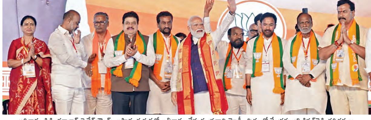
ఆదివారం సికిందరాబాద్ పెరెడ్డిగొండ్ల బహిరంగ సభలో అధిపాదం చేస్తున్న ప్రధాని మోడీ. చిత్రంలో కేంద్రమంత్రి కిషన్ రెడ్డి తదితరులు

>> ప్రధాని ఎన్డీసీని ఆదేశించారు. పెయింటింగ్ వేసిన చిత్ర కళాకారులకు తిరిగి రేఖలు రాసానని చెప్పారు. ప్రయత్నం తెలంగాణ ప్రజలందరికీ వ్యూహాత్మక శుభాకాంక్షలు అంటూ తెలుగులో మాట్లాడి ఆకట్టుకున్నారు. మోడీని చూసిన ఆనందంలో బిజెపి కేబిలు పెద్ద ఎత్తున నినాదాలతో సభ ప్రాంగణాన్ని హోరెత్తించారు. రాజకీయాల్లో గెలుపొందుటకు సమాజమున్న ప్రధాని మోడీ, పశ్చిమ బెంగాల్ లో ఓడిపోయింది రాజకీయ పార్టీ కాదని, రాజ్యాంగ వ్యతిరేక శక్తులు అన్నారు. టిఎస్పీ తానాపాపీ మోడీలతో ప్రజలను ఇబ్బంది పెట్టేదని, బెంగాల్ ప్రజలు ఇప్పుడు స్వేచ్ఛాయువు పీల్చుకుంటున్నారని చెప్పారు. పదేళ్ల క్రితం బెంగాల్ లో బిజెపి ఎమ్మెల్యేలు ముగ్గురే ఉండేవారని, ఇప్పుడు 200 మందికి పైగా గెలిచారని, పశ్చిమ బెంగాల్ లో ఆమెనీతి, కుటుంబ పార్టీలను ప్రజలు ఓడించారని తెలిపారు. బెంగాల్ విజయోత్సవం తెలంగాణలో కనిపిస్తోందని, ఆ రాష్ట్రంలో ఎలాంటి ఉత్సాహం చూపామో అప్పుం తెలంగాణలో కూడా అదే ఉత్సాహం కనిపిస్తోందని చెప్పారు. ఆస్పత్రిలో బిజెపి హాజరీకి విజయాన్ని సొంతం చేసుకుందని, పురుషేలో