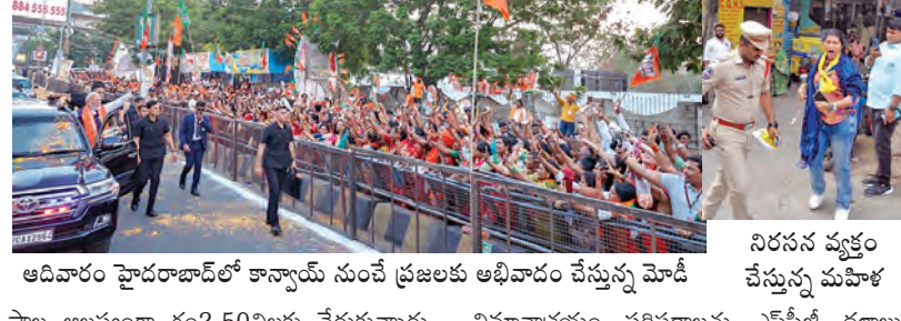
అదివారం హైదరాబాద్ లో కాన్వాయ్ నుంచే ప్రజలకు అభివాదం చేస్తున్న మోడీ

పటిష్టమైన భద్రత నడుమ రోడ్డు మార్గంలో హెచ్ఐసీకి బయలు దేరిన మోడీ కాన్వాయ్ నిరసన వ్యక్తం చేసిన అమ్ ఆర్టియూఆర్ కాంగ్రెస్, అడుపులోకి తీసుకున్న పోలీసులు