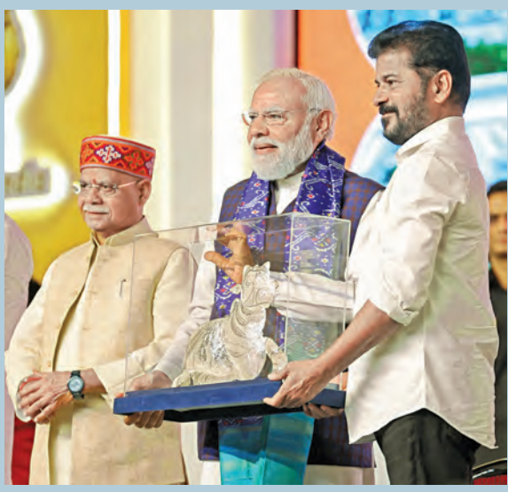
హైదరాబాద్ లో ఆదివారం హెచ్ఎస్సీలో జరిగిన సమావేశంలో ప్రధాని మోడీకి జాతీయ అందజేస్తున్న సిఎం రేవంత్. చిత్రంలో గవర్నర్ శివప్రకాష్ శుక్లా