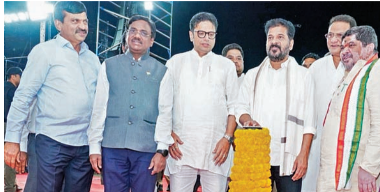
సోమవారం హైదరాబాద్ లో యంగ్ ఇండియా ఇంటెగ్రేటెడ్ స్కూళ్లకు శంకుస్థాపన చేస్తున్న సిఎం రేవంత్. చిత్రంలో మంత్రులు పొంగులేటి, వివేక్, శ్రీధర్ బాబు, అజారుద్దీన్, పొన్నం

వచ్చే యేడాది విద్యకు 15% నిధులు పెంచుతా కుల వివక్ష నిర్మూలనకే ఇంటెగ్రేటెడ్ స్కూళ్లు 500 మంది టీచర్లను విదేశాలకు పంపుతాం విద్యా వారోత్సవాలను ప్రారంభించిన సిఎం రేవంత్ రెడ్డి యంగ్ ఇండియా ఇంటెగ్రేటెడ్ స్కూళ్లకు శంకుస్థాపన